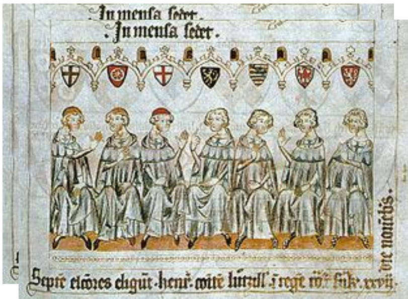
Kurfiřti při volbě Jindřicha VII. jako krále říše římské Tzv. Balduinův kodex, 1. polovina 14. století.