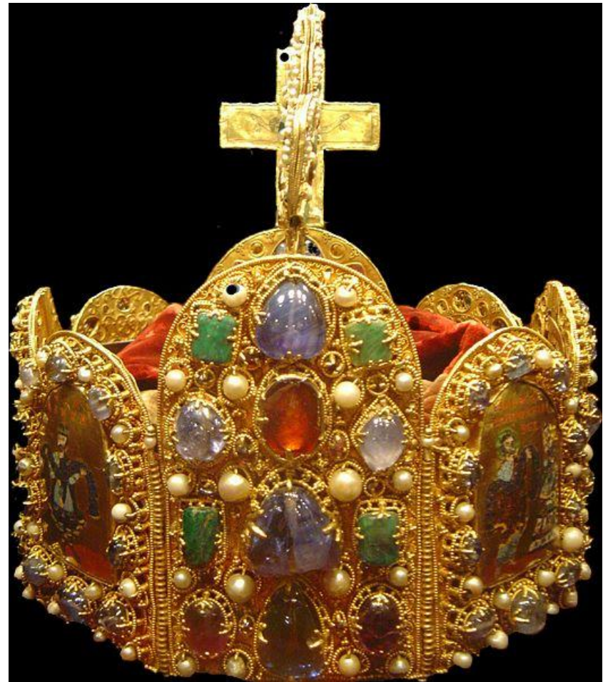
Koruna Svaté říše římské