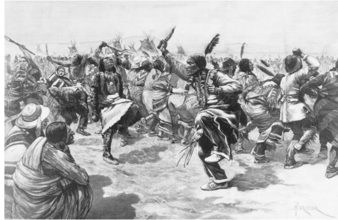
Ghost Dance of the Sioux, print from a wood engraving, 1891.

○ Zájem v rámci antropologie vyvolal ozvy v rámci různých dalších oborů, například etnobotaniky (Richard Evans Schultes).