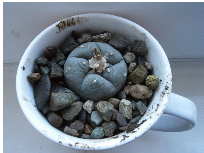
Peyote /pe'outi/ in a teacup

○ Fenomén psychedelie vzniká na univerzitách v kontextu různých přírodovědeckých a antropologických výzkumů. Fenomén psychedelie i nadále zůstává na této puště. Ve velké míře nositeli psychedelického motivu jsou univerzitní vědci.