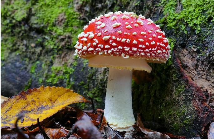
Amanita muscaria (muchomůrka červená)

Objev LSD - 30. léta, pokusy chemika Alberta Hoffmanna