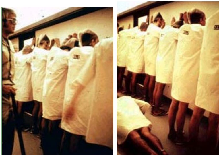
Obrázek. č. 9. Chování "dozorců" k "vězňům" ( http://www.prisonexp.org/ ).

Vztahy mezi vězni a dozorcí se rychle horšily. Pro ilustraci může sloužit následující výpověď dozorce: "Nutil jsem je, aby si vzájemně nadávali a čistili záchody holýma rukama. V podstatě jsem vězně považoval za dobytek a neustále jsem si říkal, že si na ně musím dávat pozor." (Hunt, 2010, str. 391). Druhý den vězňové zorganizovali povstání, strhali si identifikační čísla, postele postavili proti dveřím tak, aby byl dozorcům zamezen přístup do cel. Dozorci tento čin oplátili stříkáním z hasicího přístroje, svlečením, zabavením postelí a přikrývek. Vězni účastníci se vzpouře byli potrestáni odebráním jídla. Do každodennosti vězeňského života přibyla nová pravidla - buzení v průběhu noci, vymyšlení nudných a zbytečných úkolů, dbání na dodržování pravidel pod hrozbou trestu a zavírání do samotek. Dokonce i vyměšování se stalo odměnou, kterou dozorcí mohli odepřít. Po desáté hodině večerní museli všichni vězni místo toalet používat kbelíky umístěné v cele. V některých případech jim ráno nebylo dovoleno tento kbelík odnést a vyčistit.