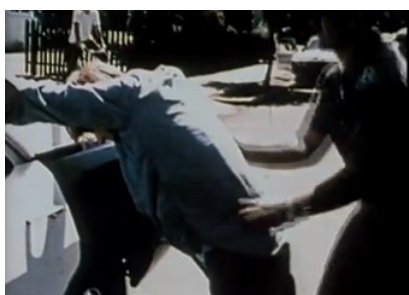
Obrázek. č. 8. Zatýkání "vězně" ( http://www.prisonexp.org/ ).

V roce 1971 se udál jeden z nejvýznamnějších experimentů sociální psychologie, který je dodnes známý pod názvem Standfordský vězeňský experiment. V novinách byl uveřejněn inzerát vyzývající k účasti na experimentu, který měl trvat dva týdny. Účastí v experimentu si probandi mohli vydělat 15 dolarů za den. Probandi museli splnit nezbytné podmínky: 1. Nepřetržitou účast (ve dne i v noci), 2. Účast na psychologickém testování (vybrání byli pouze ti probandi, jejichž výsledky byly v normě), probandi byli tedy zdraví jak psychicky, tak fyzicky, nikdy nebyli závislí na drogách a jejich záznam byl bez trestných či agresivních činů. 3. Probandi neabsolvovali žádný výcvik týkající se způsobů, jak hrát náhodně přidělené role.