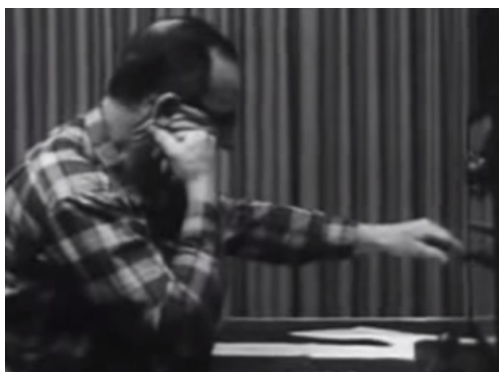
Obrázek. č. 7. "Učitel" udělující elektrické šoky.

( https://www.youtube.com/watch?v=xOYLCy5PVgM )