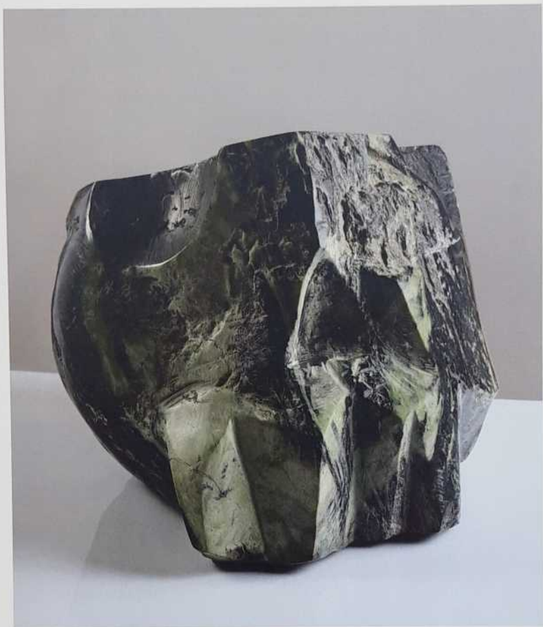
Lebka, serpentin, 24 x 28 cm, 1985