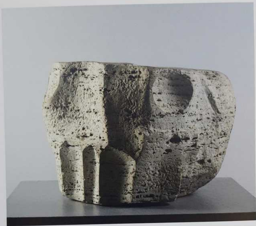
Lebka, travertin, 29 x 33 cm, 1965