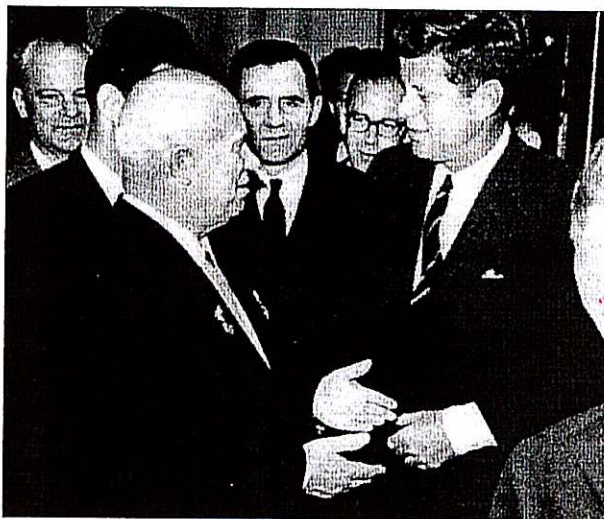
Setkání Chruščova a Kennedyho ve Vídni (červen 1961)

prodlužující současný stav o jeden a půl roku, západní mocnosti však zato měly poskytnout kompenzaci. Šlo o snížení stavu jejich jednotek ve městě na symbolickou úroveň, zastavení propagandy proti NDR a závazek nerozmísťovat jaderné zbraně a rakety. Čtyřmocenský výbor měl kontrolovat plnění těchto požadavků. SSSR tak ve skutečnosti žádal nejen podíl na rozhodování v Západním Berlíně, ale také omezení svobody slova a tisku. Stanovisko Kremlu bylo pro Západ s výjimkou zákazu instalace jaderných zbraní a omezení