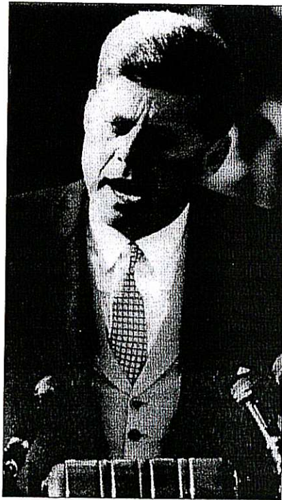
Prezident John F. Kennedy pronáší řeč při nástupu do úřadu (20. ledna 1961)

Německý kancléř si od konference ministrů zahraničních věcí sliboval snížení mezinárodního napětí. I když Chruščov původně požadoval okamžité setkání nejvyšších představitelů vítězných velmocí, 30. března 1959 souhlasil s přípravnou ministerskou schůzkou v Ženevě. Západ ale musel vyhovět sovětské žádosti a stáhl z jejího programu navrhovanou výměnu názorů na situaci ve východní Evropě. Rozhovory proběhly ve dvou fázích 11. května až 24.