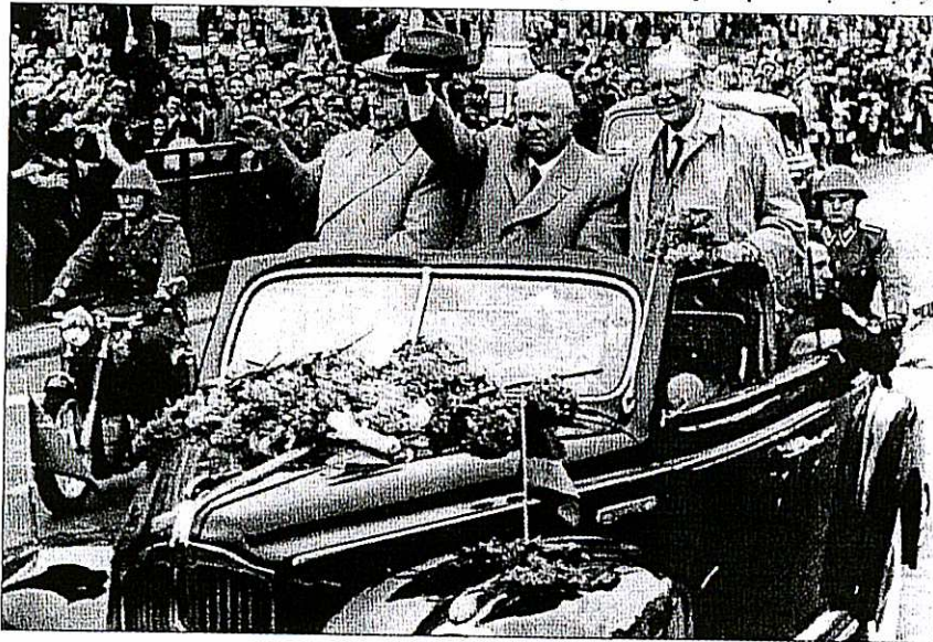
Návštěva N. S. Chruščova ve východním Berlíně (1960). Po jeho pravici tehdejší šéf Státní rady Walter Ulbricht, po levici předseda vlády Otto Grotewohl

16. února 1959 odpověděly vlády západních mocností na sovětský návrh mírové smlouvy s Německem. Prohlásily sice, že si vyhrazení právo na svobodný přístup do Berlína, navrhly však zároveň svolání konference ministrů zahraničních věcí čtyř okupačních mocností. Spolková vláda se k sovětskému návrhu postavila téhož dne kriticky a shodně se Západem prohlásila, že před zahájením mírové konference bude nezbytná