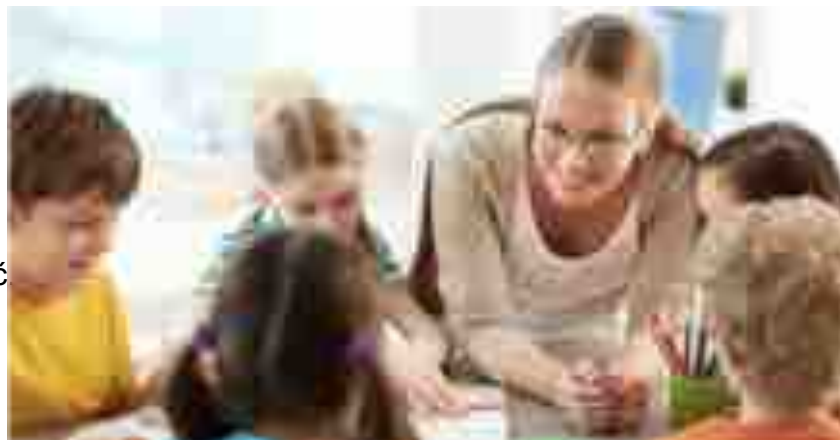
Implementace ICT do výuky č