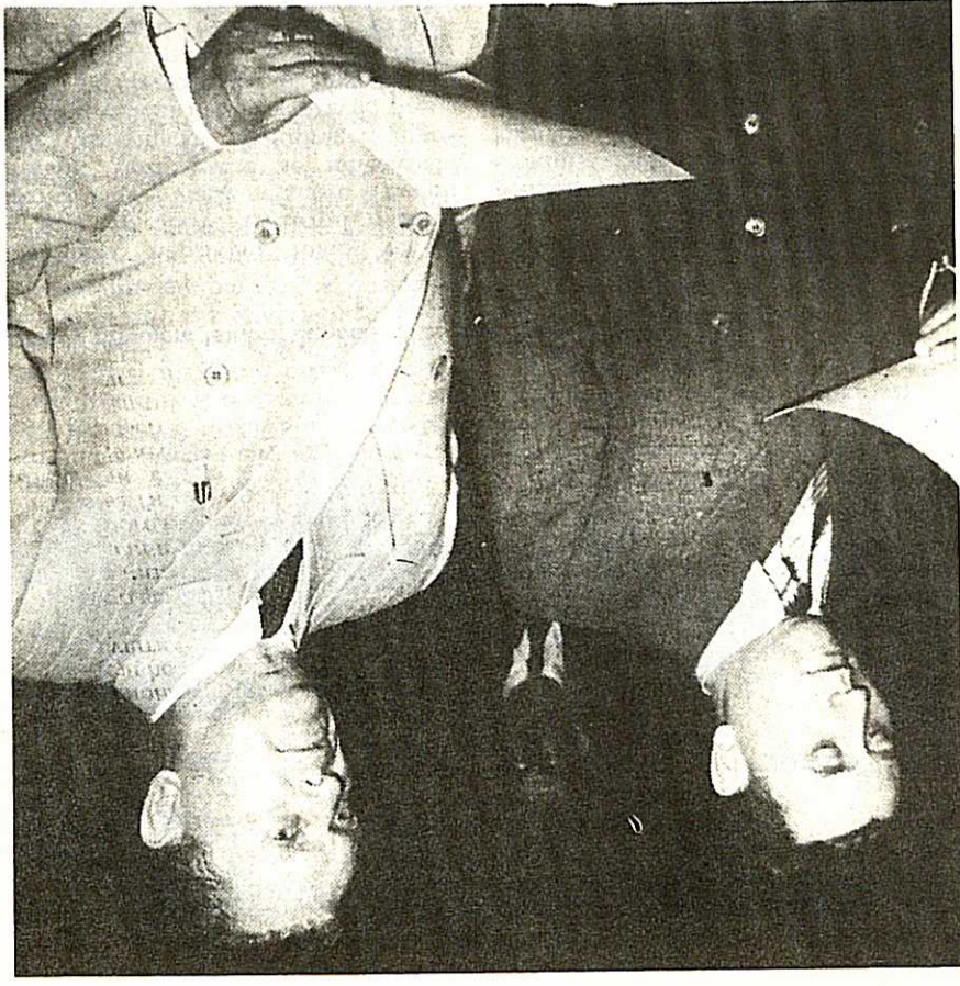
Josip Broz Tito (vpravo) a Alexandr Ranković na zasedání skupštiny 24. dubna 1950

na sebe nedala postoje Titova vedení, na sebe nedala dlouho čekat. 18. března zaslal sově- tský ministr obrany Nikolaj Bulganin vláde FLRJ dopis, v němž jí oznámil, že odvolává z jugoslávské armády všechny sovětské poradce. O dva dni později byl dopisem ministra zahra- ničních věcí Vjačeslava Molotova sta- gram a že se nachází v jugoslávském civilním sektoru. Odvolání sovětská strana stručně zdůvodnila tím, že po- radci byli obklopeni atmosférou ne- důvěry a nepřátelství. 17 Obširnější vysvětlení přišlo za tý- den, 27. března — nikoli v náhodou meckého režimu prince Pavla a před- sedy vlády Dragiši Cvetoviče — ob- drželo vedení KSJ obširný dopis po- depsaný Stalínem a Molotovem. Do- pis adresovaný „soudruhů Titovi! a ostatním členům ÚV KSJ“ obsaho- val obvinění z řady závažných politič- kých chyb. V úvodu se autoti dopisu vraceli k odvolání sovětských expertů. Zno- vu opakovali, že poradci byli vystave- ni šikanování a neustále je sledovala jugoslávská tajná bezpečnost. Další část dopisu obsahovala všemožná ob- vinení z různých „ideologických hri- chů“. Vedle rozpoutání atmosféry velmocenského šovinismu a otevře- ného antisovětsismu v ústředních stát-