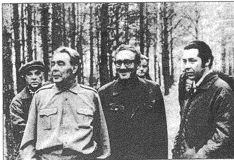
Brežněv s poradcem amerického prezidenta Nixona, H. Kissingerem na lovecké dači v Davidovu v roce 1973

vova návštěva Spojených států ve druhé polovině června 1973. Nikdy od druhé světové války nebyl mezi Washingtonem a Moskvou takový „nedostatek“ sporných bodů jako nyní. Stejně jako před rokem podepsali oba státníci i nyní další sérii celkem 11 smluv, z nichž tři se týkaly jaderné oblasti. Bylo rozhodnuto vytvořit společnou komisi pro mírové využití jaderné energie, obě strany se shodly na základních principech budoucí dohody o omezení strategických zbraní, která měla dát impuls rozhovorům SALT II v Ženevě. Konečně byla uzavřena dohoda o odvrácení jaderné války, v níž se obě strany zavázaly, že v případě nebezpečí vzniku jakéhokoliv konfliktu se budou vzájemně informovat a konzultovat.