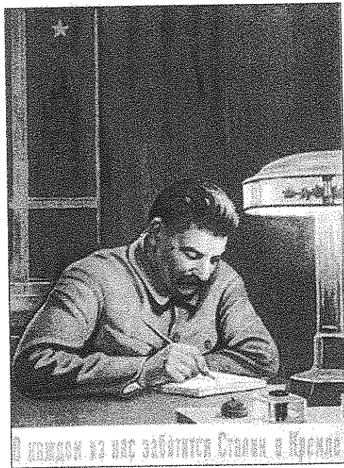
Sovětská propaganda doznala zejména na počátku války značného posunu. Stalin, který „se o nás všechny stará“, načas usloužil Matce - Vlasti

Válka rovněž změnila poměr sil mezi jednotlivými mocenskými složkami státní a stranické hierarchie. Ze sevřené stranické kontroly se do jisté míry