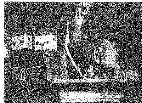
Andrej A. Ždanov

Kampaň zahájil Ždanov v srpnu 1946 ostrým útokem proti leningradským spisovatelům Anně Achmatovové a Michailu Zoščenkovi a časopisům Zvezda a Leningrad , které obvinil ze „servilnosti vůči všemu cizímu“. Zoščenko byl obviněn z ideologického nihilismu, z nezájmu o pracující sovětský lid, jeho hrdinství a vysoké morální kvality. Lyrická básnířka Achmatovová pak ze šíření pesimismu, dekadence a buržoazně aristokratické estetiky. Nejvý-