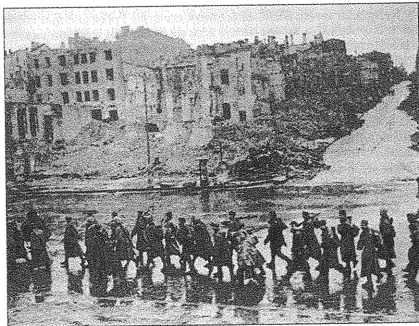
Během války byla řada sovětských měst prakticky zničena

Sovětský svaz utrpěl za války zcela mimořádné ztráty ve všech směrech. V roce 1945 například průmyslová produkce na osvobozených územích, která patřila do roku 1941 k nejrozvinutějším v celém SSSR, činila pouze asi