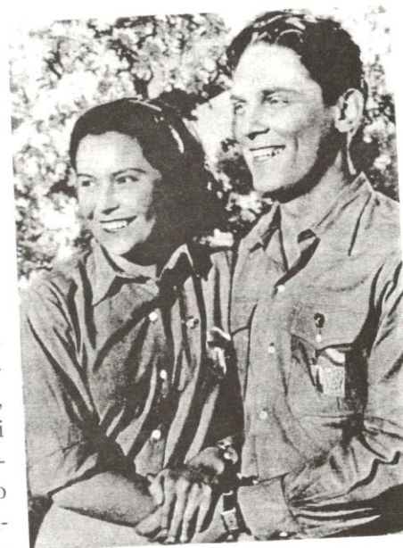
Agitace rozjásaného svazáckého mládí

Státní bezpečnost byla ukázkovým příkladem zneužití mládeže pro potřeby diktatury . Komunistická agitace rozjásaného mládí s vyhrnutými rukávy směle hledícího ke komunistickým obzorům využívala zkušeně generačního konfliktu. Mládež byla vděčným objektem jejího působení. Nebyla zatížena etickými humanitními principy, demokratickou politickou kulturou, kterou nezažila, neměla zkušenosti z životní praxe a její vzdělání ustulo na elementární fázi, nebo nebylo ještě dovršeno. Mladý idealismus, věřící v program, vůle přinášet oběti, mladistvá netrpělivost,