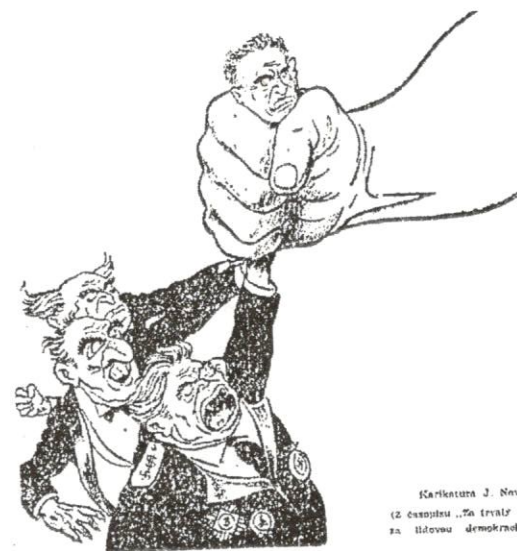
DOPADENÍ PŘI ČINU