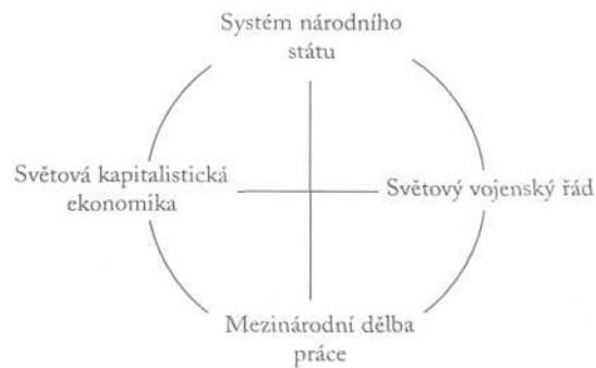
Schéma 2. Dimenze globalizace

Uvažujeme-li o dnešní situaci, v jakém smyslu můžeme říci, že světové ekonomické uspořádání je ovládáno kapitalistickými ekonomickými mechanismy? Při odpovědi na tuto otázku je třeba vzít v úvahu řadu faktorů. Hlavními centry moci jsou ve světové ekonomice kapitalistické státy — státy, ve kterých je kapitalistický výrobní podnik (spolu s třídními vztahy, které zahrnuje) hlavní formou produkce. Domácí a mezinárodní ekonomické politi-