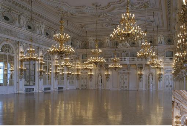
Salle espagnole, Château de Prague