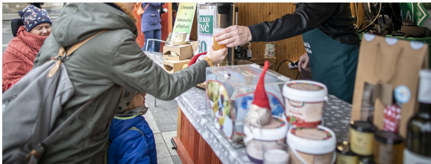
Kandidát na prezidenta Petr Pavel v Brně.

„Synovi se moc líbil a vánoční kelímeček od nealkoholického punče si chce nechat na památku. Uznávám, že má upřímný stisk ruky a přímý pohled, ale finální rozhodnutí si nechávám nadále otevřené,“ doplňuje.