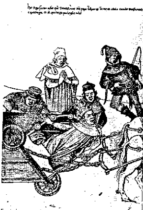
ČTENÁŘ, 42, 1990, č. 5