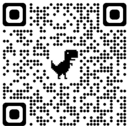
odkaz na program AI

(Osobu popisujte v celých větách. Všímejte si detailů.)