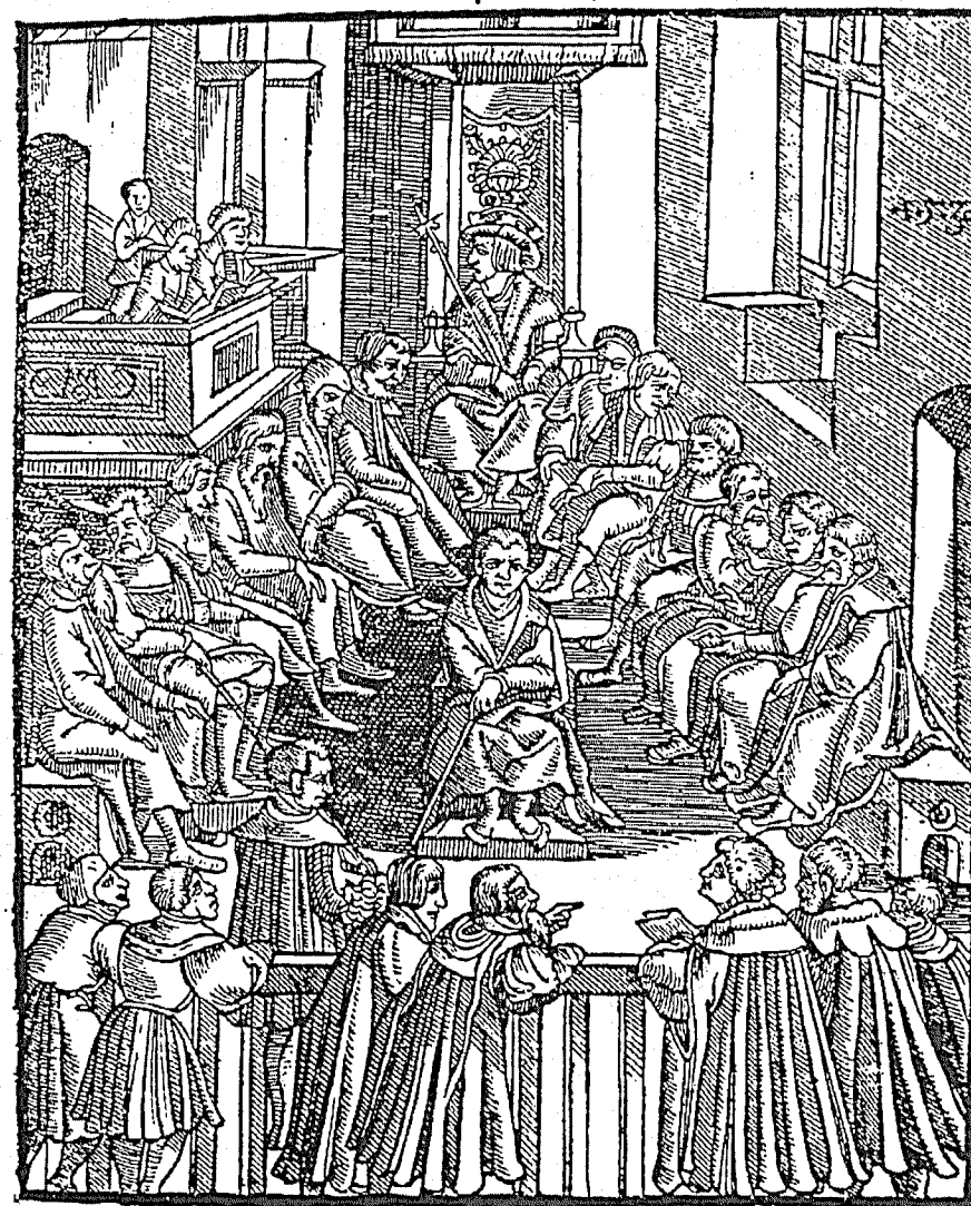
Zasedání většího zemského soudu (jádra českého sněmu) na Pražském hradě, dřevorez v Zřízení zemském Království Českého . Praha 1530