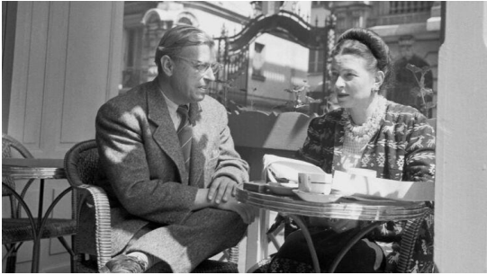
Sartre a Simone de Beauvoir v kavárně