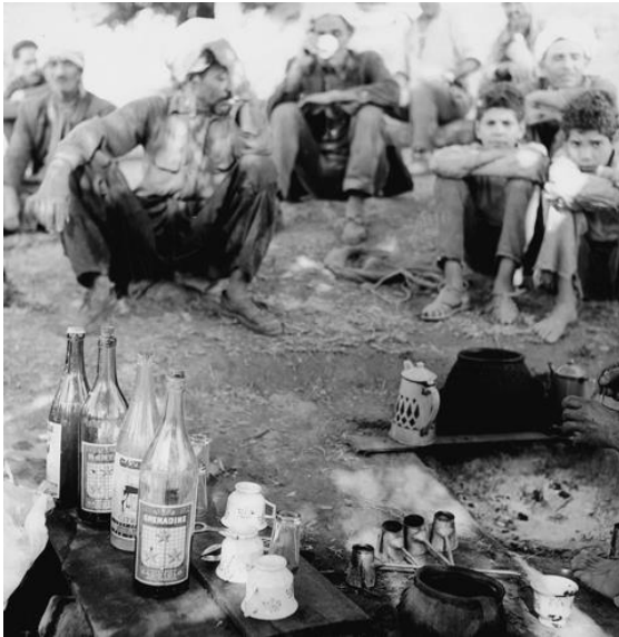
Výjev z Alžírska, 1957 – 1961