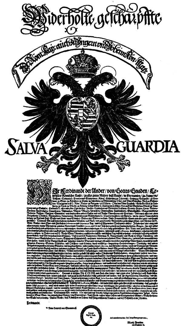
1. 1, kterým velitel vojska nebo panovník zaručoval osobě, městu, osadě či instituci ochranu majetku před rabováním, se nazýval Salva guardia. 1. 2 době třicetileté války však bývala i takováto ochrana neúčinná.

Nižší složky státní správy, které se během povstání dostaly blíž ke středu dění než vyšší úřady, užívaly vůči poddaným vyčkávací