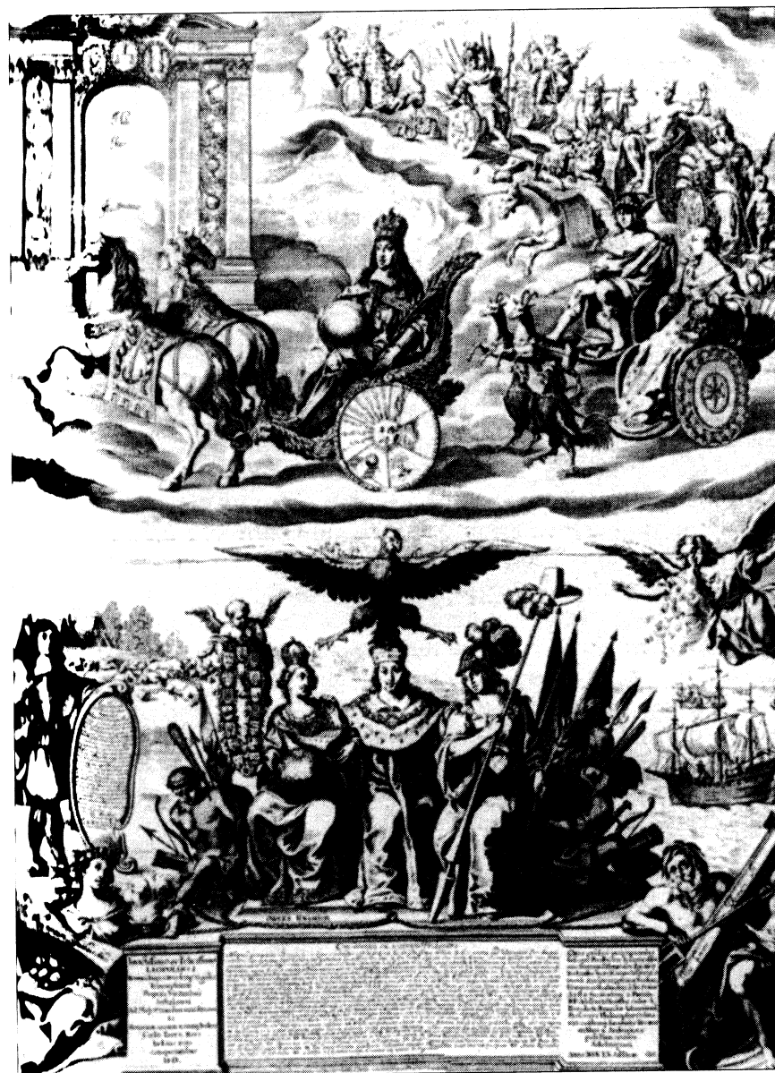
Sjednocení habsburských zemí pod vládou Leopolda I. Altdiryt Bartholomea Kiliána podle Burckharta Schramma z roku 1660.

Pro danou situaci bylo nejpodstatnější, že ustanovení postavilo mimo zákon ty poddané, kteří si stěžovali a nemohli se opřít o nějaká nově potvrzená privilegia. Na základě znalostí zachovaných