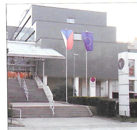
sídlo úřadu ombudsmana

Významnou úlohu v demokratických státech mají i hromadné sdělovací prostředky , které na případy porušování lidských práv upozorňují a často lidem pomohou.