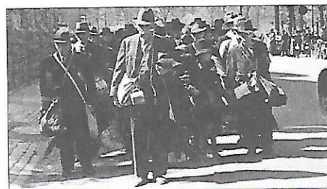
transport Židů za 2. světové války

Jednou z forem rasismu i náboženské nesnášenlivosti je nenávisť vůči Židům, tzv. antisemitismus . Židé byli po staletí pronásledováni. Nenávisť k nim a snaha zmocnit se jejich majetku vyvrcholily během 2. světové války v letech 1939–1945. Miliony Židů zemřely v koncentračních táborech. Toto hromadné pronásledování a vyvražďování Židů, ale také Romů a dalších skupin lidí (vězňů, homosexuálů...), prováděné nacistickým Němcem a jeho spojenci, se nazývá holocaust .