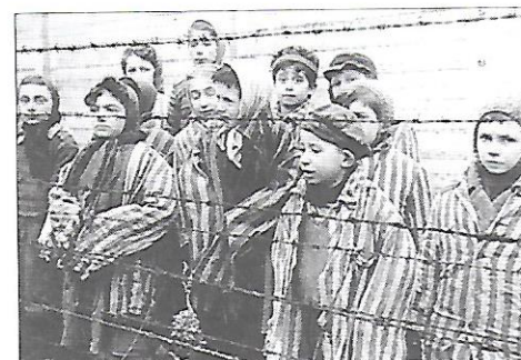
hrůzné podmínky života dětí v koncentračních táborech za 2. světové války

Obvykle uváděný počet židovských obětí za 2. světové války je 6 milionů. Vyvražďeny byly asi dvě třetiny evropských Židů, většinou z Polska. Dalším terčem vyvražďování byli Romové. Odhadovaný počet obětí romských obyvatel je 250 000–500 000 (některé zdroje uvádějí 800 000). Oběťmi holocaustu byly i miliony židovských a romských dětí. Přes tato hrůzostrašná fakta je v dnešní době neonacisty a některými autory holocaust popíráni a jeho oběti znevažovány.