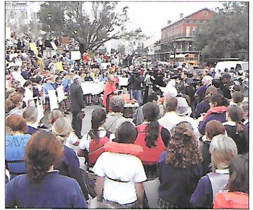
demonstrace – jeden ze způsobů odporu veřejnosti proti porušování lidských práv

K porušování lidských práv dochází často vlivem předsudků . Předsudek je posuzování lidí podle toho, co jsme o nich slyšeli nebo co se o nich obecně říká, aniž bychom zkoumali pravdivost takového tvrzení. Předsudky jsou dány naší výchovou a kulturou, ve které žijeme a která ovlivňuje naše vidění světa. Díky tomu často pokládáme to, co známe, za jediné správné. Předsudky se tedy často obracejí proti lidem, kteří se nějak odlišují od většiny – mají např. jinou barvu pleti nebo jinak žijí.