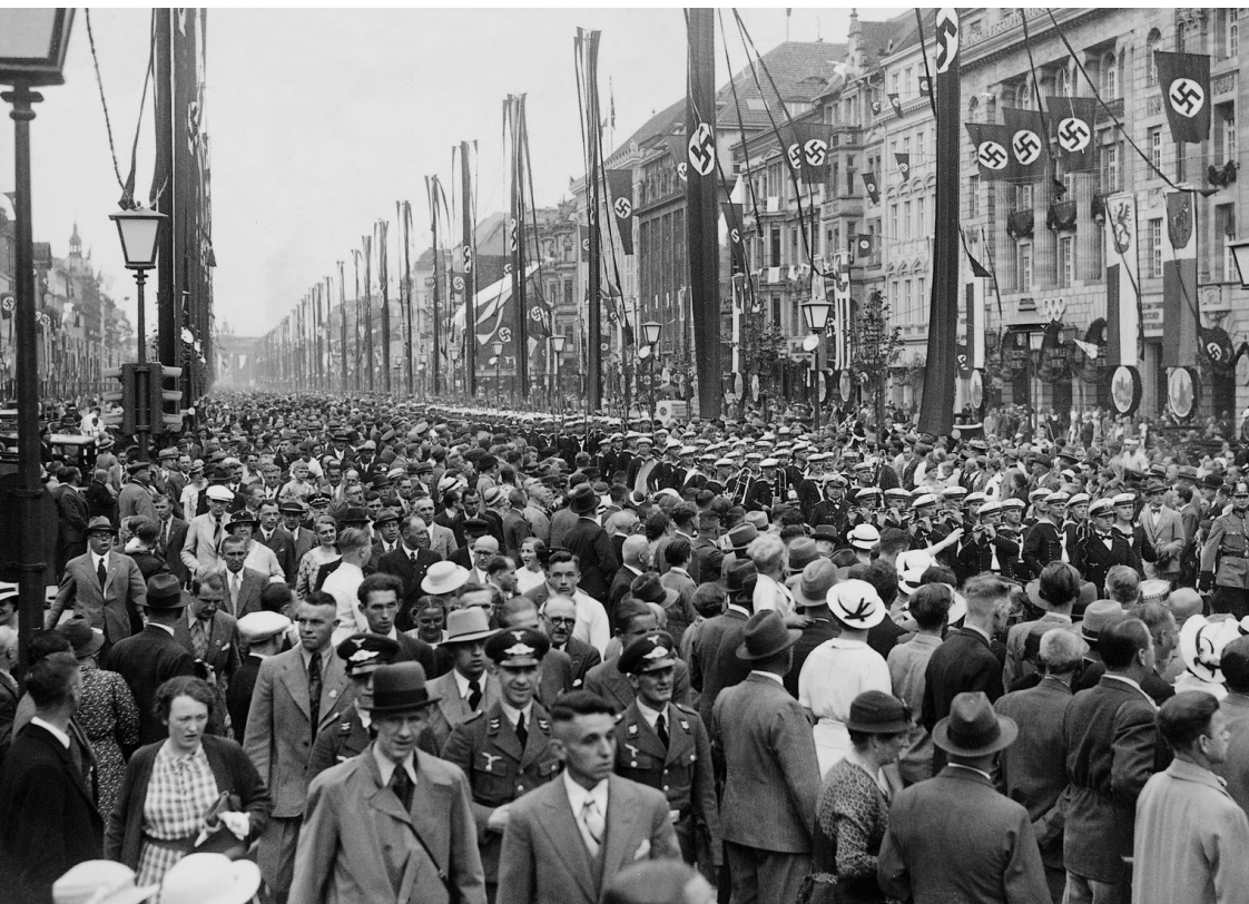
„Vyzdobená ulice s návštěvníky“, https://cdn.prod.www.spiegel.de/images/cdd38df4-0001-0004-0000-0000001027875_w1528_r1.397096941420425_fpx54.36_fpy49.98.jpg pg.