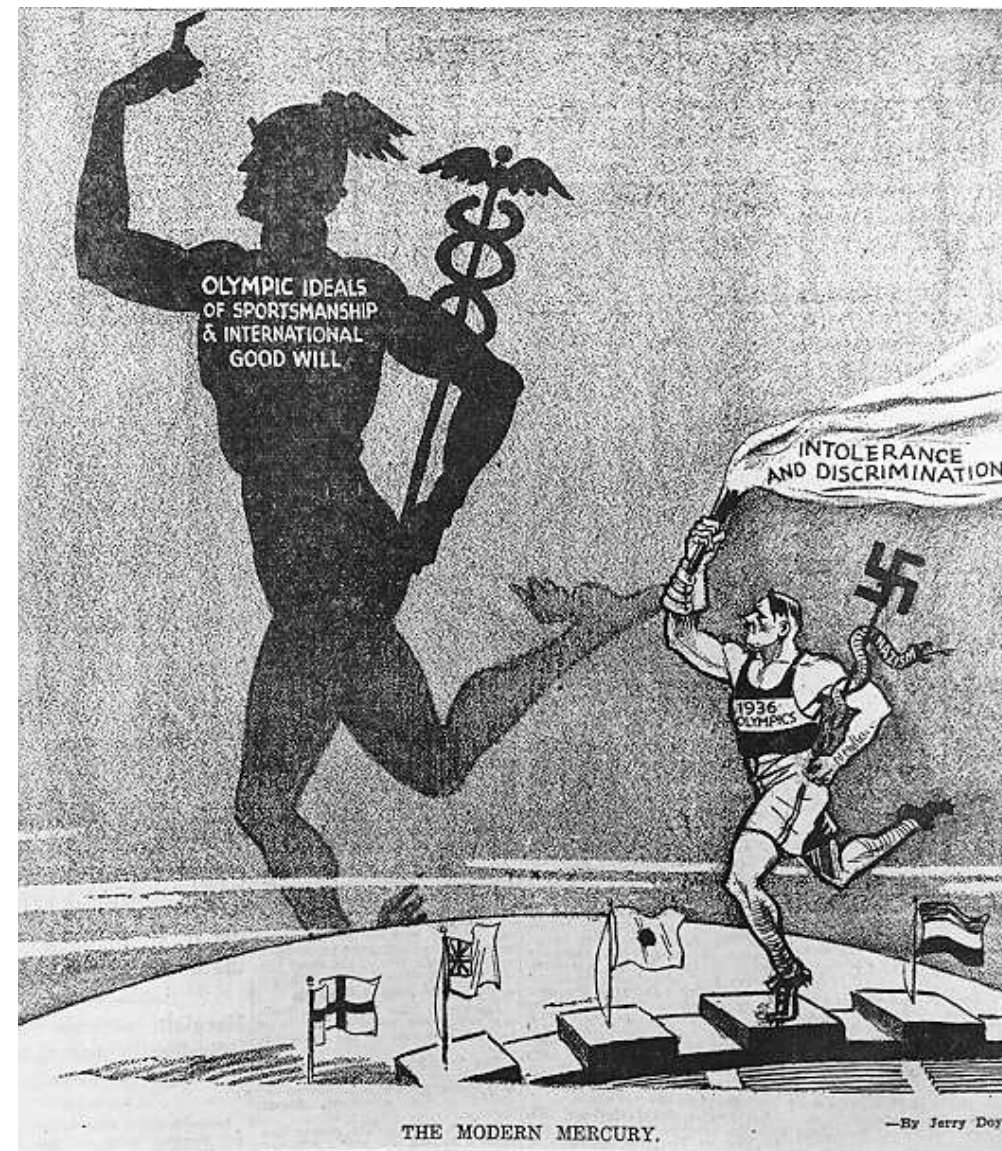
„Ilustrace ‘The Modern Mercury’ od Jerryho Doylea v The Philadelphia Record“, https://www.ushmm.org/exhibition/olympics/images/large/c20-1.jpg .