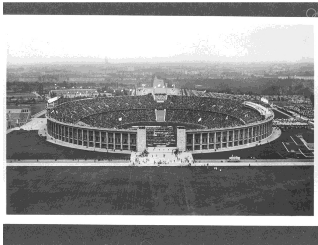
Berlin 1936-Le stade olympique vu de la tour de la Cloche