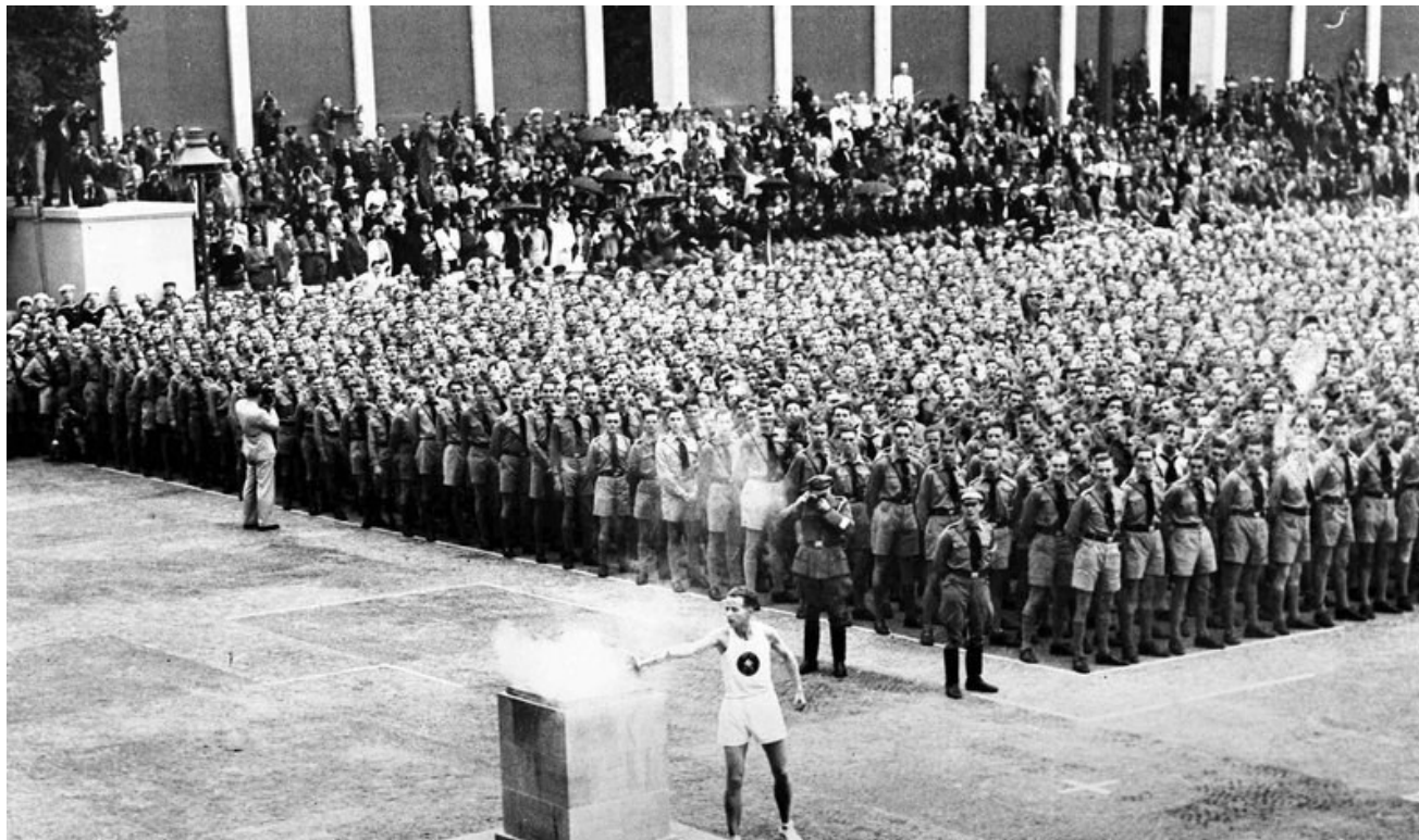
„Zapálení olympijského ohně“, https://apnews.com/article/220639ad71237c04243bc95bb887812e/gallery/cfb29e1279443169b34dd4e621253ad .