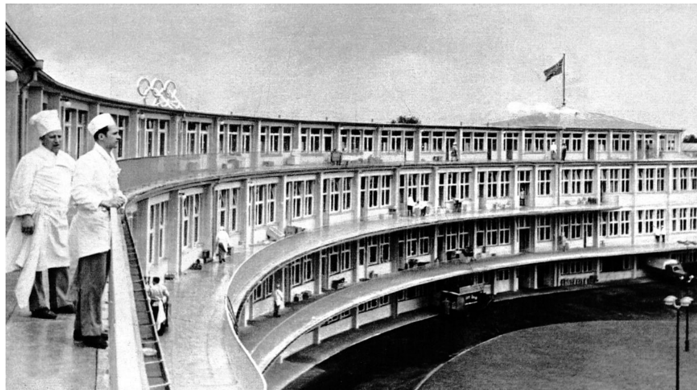
„Olympijská vesnice 1936“, https://img.morgenpost.de/img/brandenburg/crop135739420/6117652928-w1200-cv16_9-q85/Olympisches-Dorf-Elstal-Speisehaus-der.jpg