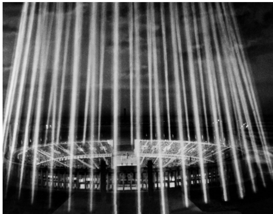
„Světelná kopule ze světlometů“, https://cdn.prod.www.spiegel.de/images/53b71857-0001-0004-0000-000001027872_w1528_r1.2452309236947792_fpx40.16_fpy50.jpg .