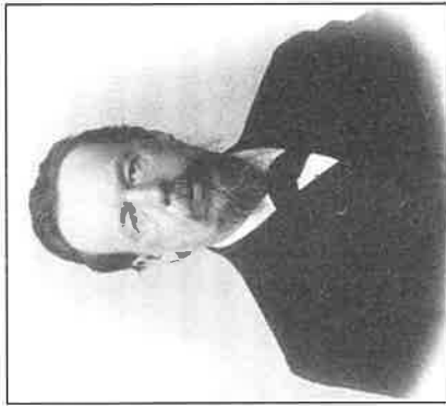
Alexander Štěpanovič Popov

Otec nechal Popova vystudovat v semináři, aby kráčel v jeho šlépějích, avšak Alexander se víc než o teologii zajímal o matematiku a fyziku. Nejspíš z finančních důvodů se záhy ve své vědecké kariéře dal do služeb jak univerzity v Petrohradu, tak i carského námořnictva. 24. března 1896 na sjezdu společnosti ruských fyziků a chemiků Popov předvedl pokusný radiový přenos mezi dvěma univerzitními budovami. Na vzdálenost 243 metrů vysílal morseovkou bezdrátový telegrafický signál. Přenos v Morseově abecedě prý slyšeli zcela jasně všichni přítomní v přijímací místnosti. Jeden z nich napsal na černou tabuli jméno, všem srozumitelný výsledek experimentu: Heinrich Hertz . Z Hertzova výzkumu se Popov hodně poučil, pokusil se na něj navázat a právě na jeho počest pokusný přenos uskutečnil. Problém byl v tom, že Popovův úspěšný experiment nebyl nikde oficiálně zaznamenán. Toto prosté opomenutí dalo podnět k dodnes trvajícím nelibostnému souboji o prvenství rozhlasového přenosu mezi příznivci Popova a Itala Marconiho, „markonisty“.