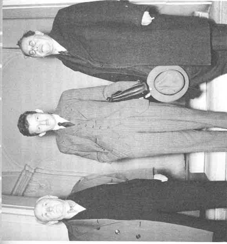
Wenzel Jaksch (uprostřed) spolu s kolegy z Německé sociálně demokratické strany dělnické po poradě s ministerským předsedou Milanem Hodžou 15. června 1938