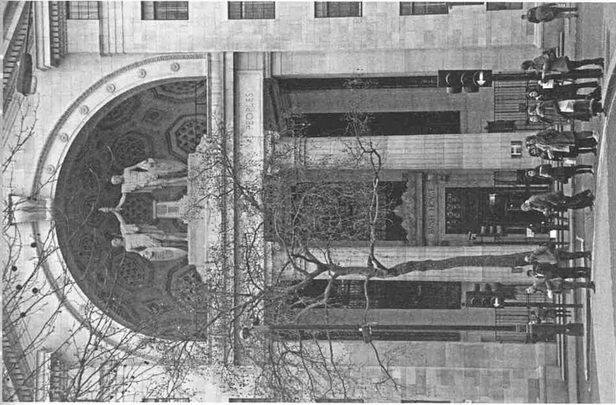
Impozantní vstup do Bush Housu

Bush House byl slavnostně otevřen v Den americké nezávislosti 4. července 1925 lordem Arthurem Jamesem Balfourem