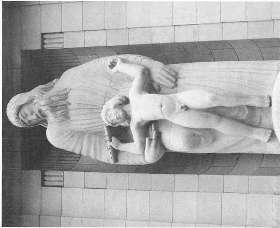
Detail plastiky Prospero a Ariel