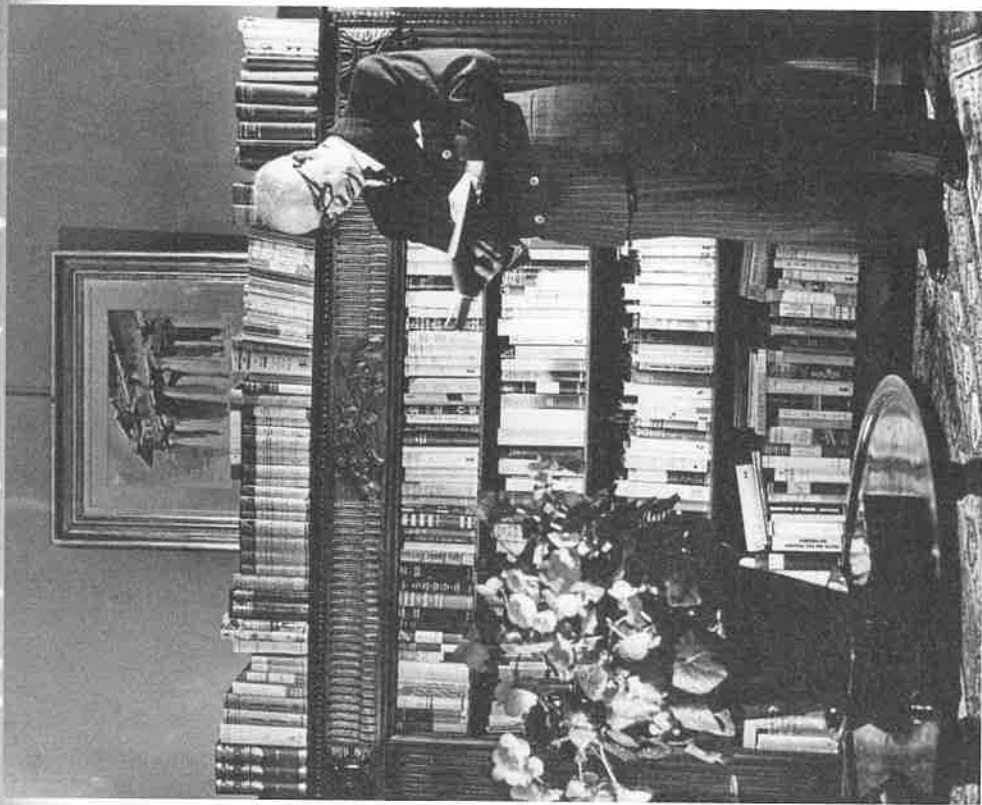
Prezident Edvard Beneš ve své knihovně v Buckinghamshire v roce 1944

Jedním z nejoblíbenějších spíkrů BBC byl Jan Masaryk (1886–1948), který se po návratu ze Spojených států stal ministrem zahraničí exilové vlády. Syn jednoho ze strůjců zrození Československé republiky Tomáše Garrigua Masaryka (1850–1937) mlátil v éteru do německých okupantů svými vyřečnými ústy hlava nehlava, a to nejen v českém a slovenském vysílání, byl zván i do anglického studia. Angličtinu perfektně ovládal z doby svého pobytu ve Spojených státech před první světovou