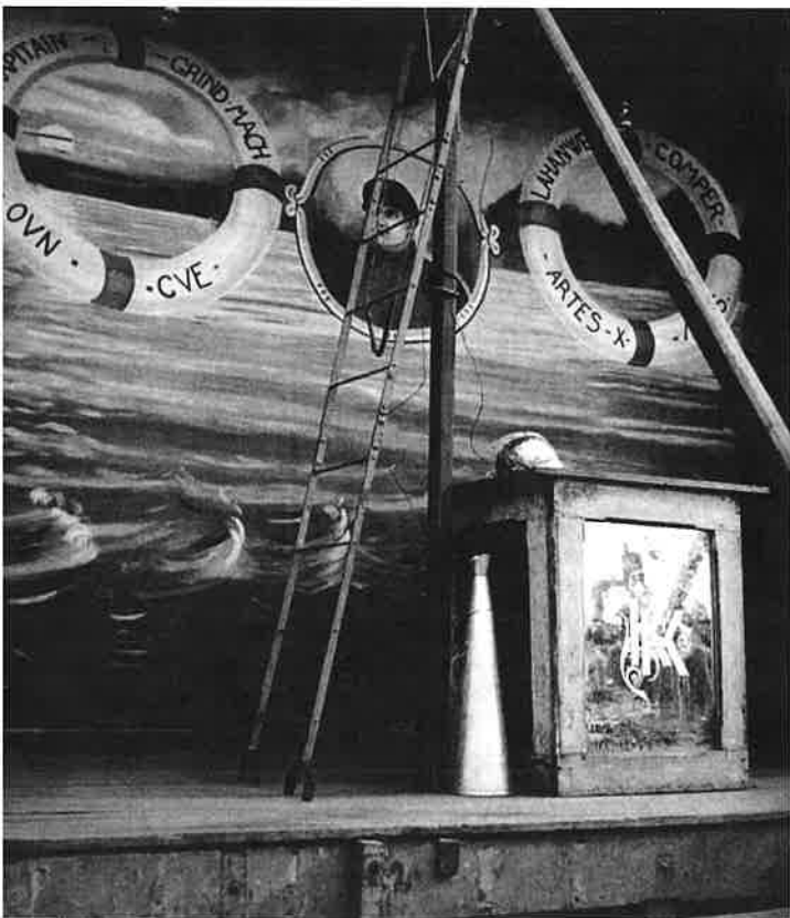
Jindřich Štýrský: Z cyklu Muž s klapkami na očích, 1934

a to s ohledem na rozdílnou moc při výběru toho, na co a s jakou intenzitou se budou dívat, s ohledem na způsob, jak se budou dívat, a také s ohledem na volbu konkrétního pořadu. Nicméně nepředpokládám, že jsou tyto empirické odlišnosti vyjádřením jejich esenciálních biologických mužských nebo ženských vlastností. Přikláním se spíše k tvrzení, že tyto rozdíly jsou důsledkem konkrétních sociálních rolí, které doma zaujímají jako muži a ženy. Navíc nepředpokládám, že by se konkrétní model genderových vztahů, který jsem našel v rámci domácnosti (se všemi důsledky, které má pro chování při sledování televize), musel nutně opakovat buď v nukleárních rodinách z různého třídního nebo etnického prostředí, nebo v různých typech domácností se stejným třídním nebo etnickým původem. Vždy jde spíše o to, zda a jak genderové vztahy působí a jsou utvářeny v rámci těchto různých kontextů.