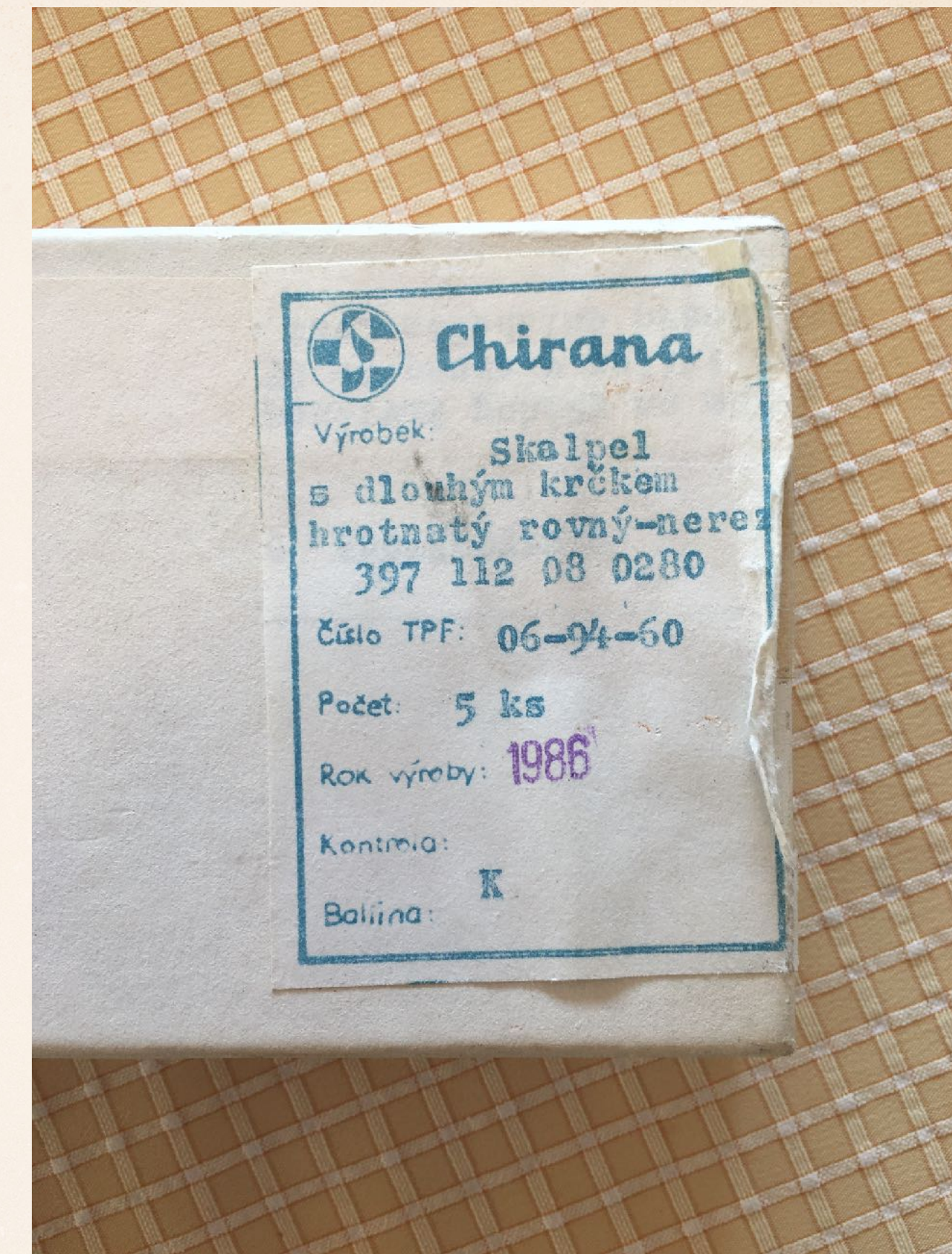
SADA CHIRURGICKÝCH SKALPELŮ CHIRANA, R. VÝROBY 1986