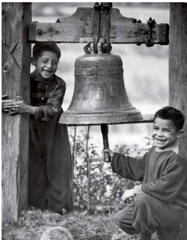
„Dědičovy děti“, žáci jeho školy