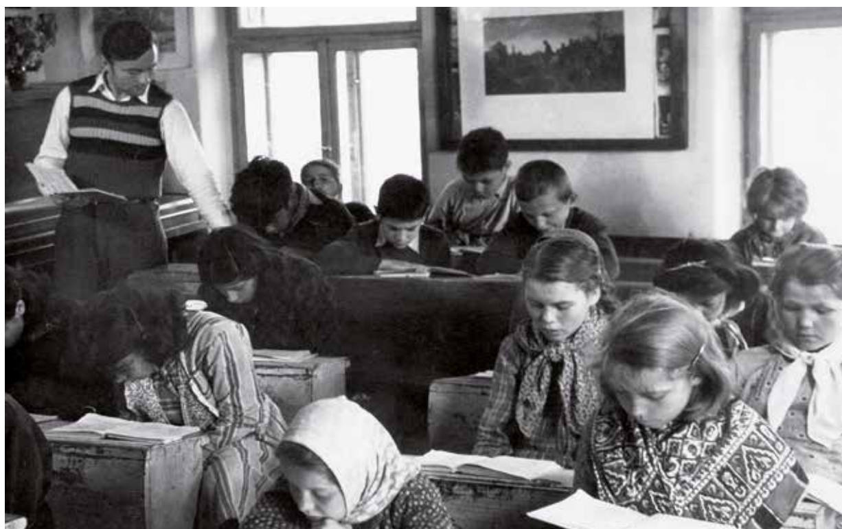
Výuka v květušínské škole