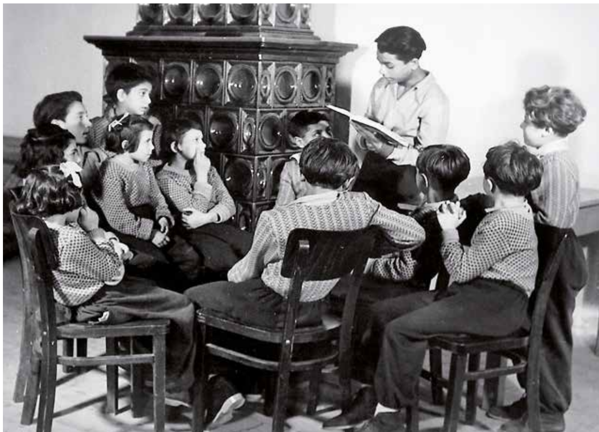
Volný čas svěřenců internátní školy v Květušíně