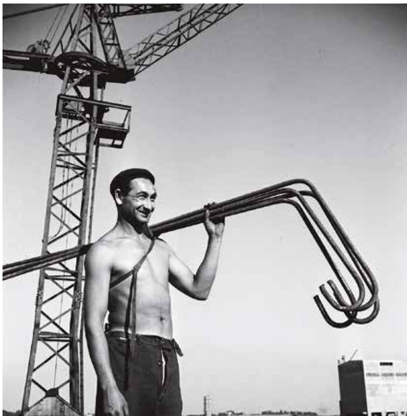
Integrace Romů do pracovního procesu neměla proběhnout na základě byrokratických nařízení a represe, ale z vlastní vůle samotných Romů

prostředí a přivedeny k tomu, aby se sžily s prostředím řádně občanským. Internaci dospělých by bylo snad nejlépe zařídit v osadách při zemědělských statcích, zemských nebo také obecních statcích, na nichž by pod řádným vedením vykonávali všechny potřebné práce [...] Bylo by to zařízené poměrně nejlidštější a také hospodářsky nejúčelnější při nezbytné ovšem důslednosti a přísné kázní. 3