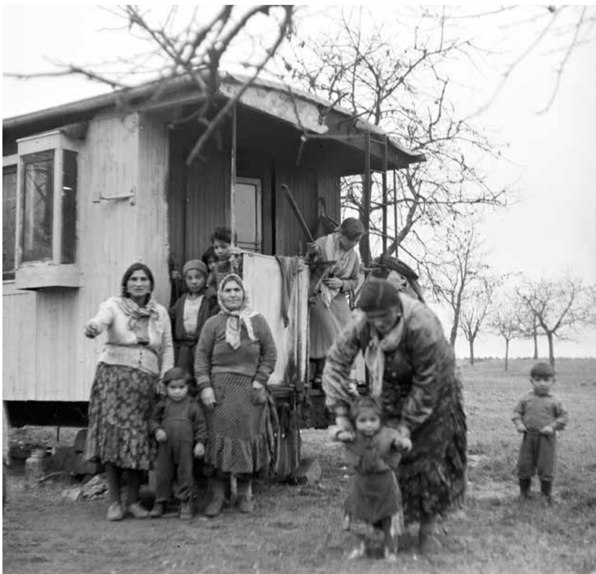
Olašští Romové v českých zemích po nuceném usazení na konci padesátých let