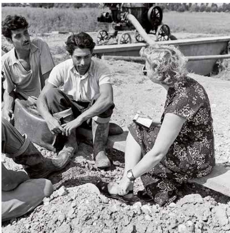
Rozhovor s Romy na stavbě socialismu. Články v médiích měly posilovat víru v úspěšnou emancipaci Romů skrze práci.