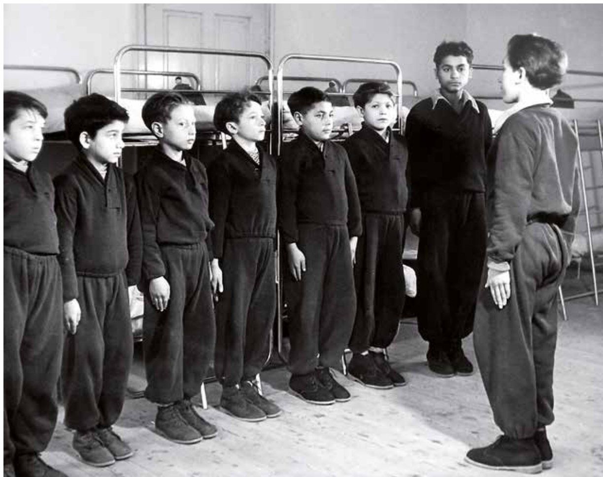
Internát v Bílině, nástup