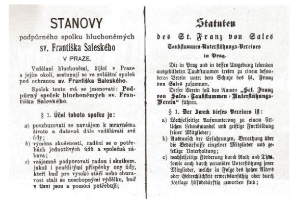
Stanovy Podpůrného spolku hluchoněmých sv. Františka Saleského