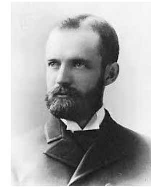
William Isaac Thomas (1863-1947)

W.I. Thomas: The unadjusted girl . [1923] (42-50)