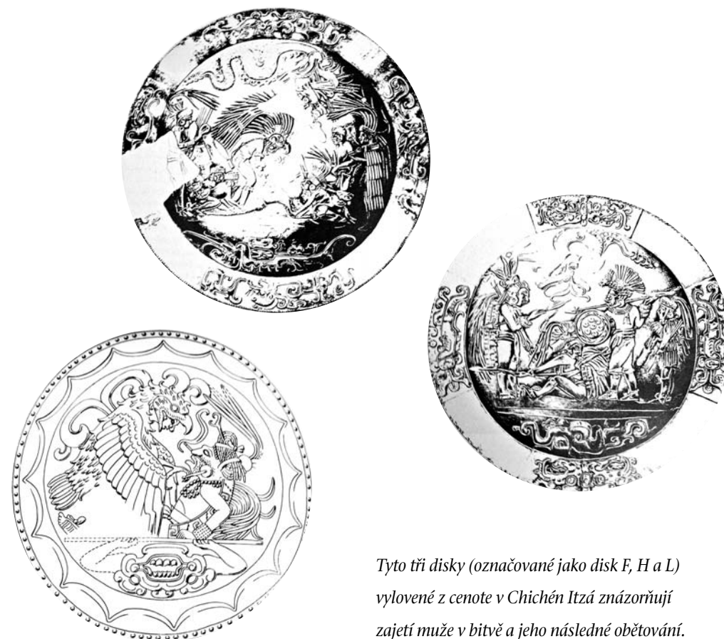
Tyto tři disky (označované jako disk F, H a L) vylovené z cenote v Chichén Itzá znázorňují zajetí muže v bitvě a jeho následné obětování.

Hned na úvod je třeba upozornit, že lidská oběť byla v Mezoamerice tak intimně svázána s válkou, že jedno od druhého vlastně nelze smysluplně oddělit. To souvisí s odlišným konceptem války – hlavním cílem bitvy totiž nebylo nepřítel zabít, ale zajmout jej, samozřejmě proto, aby byl později obřadně obětován.