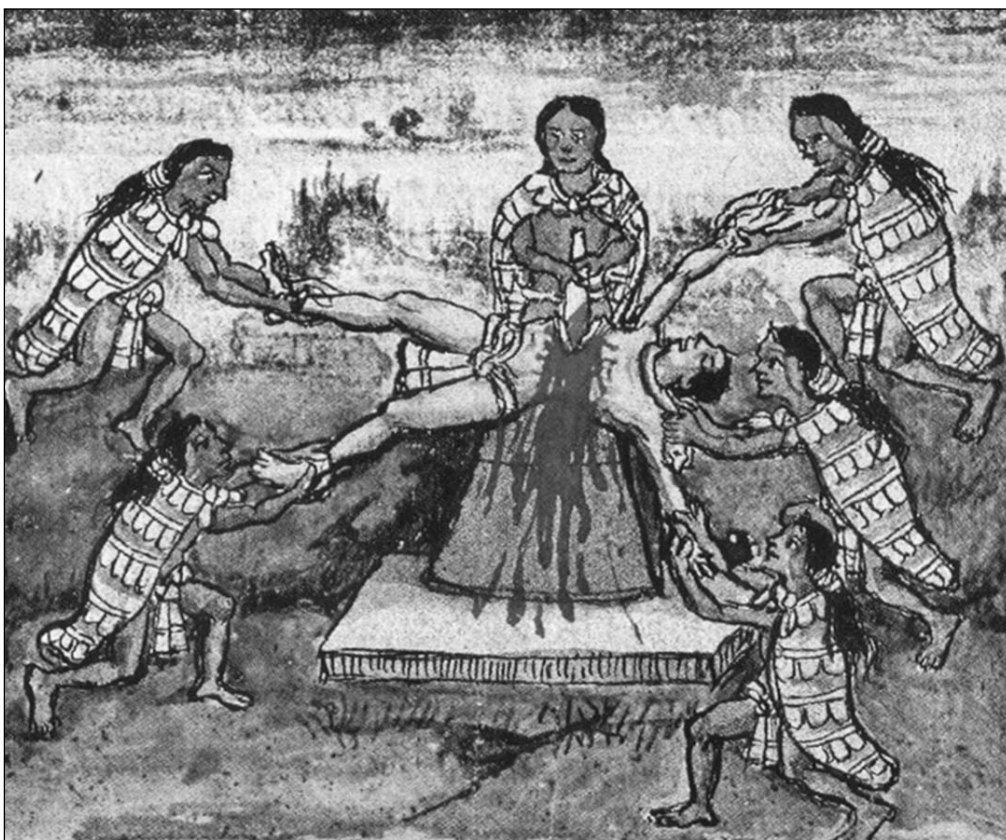
Scéna aztécké oběti vyrváním srdce v koloniálním tzv. Duránově kodexu

se zbytkem hrudi. Ještě tepající srdce pak obvykle ihned nabídl bohům – a to tak, že je buď položil do obětní misky, nebo vložil do úst idolu, případně je urychleně pozvedl nad sochu, aby poslední stahy svalu postříkaly krví tvář božstva. Celý proces se musel odehrát během pouhých několika okamžiků, a to z několika důvodů. Za prvé, oběť se pravděpodobně ve většině případů vzpouzela a strach a v závěru i bolest jí musely dodávat neobyčejnou sílu, takže hrozilo nebezpečí, že se asistentům vysmekne a hladký průběh rituálu bude narušen. Za druhé pak srdce po vytržení ze svého lůžka udeřilo většinou již jen několikrát a zásoba krve se vyčerpala prakticky okamžitě, takže pokud bylo účelem rituálu skropit stříkající krví sochy bohů, musel obětník jednat s bleskovou pohotovostí. 10