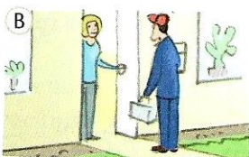
auf den Techniker warten