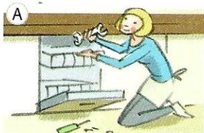
die Spülmaschine reparieren