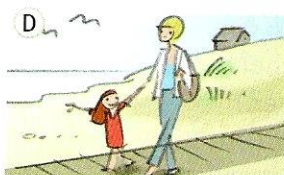
einen Ausflug mit Sara machen