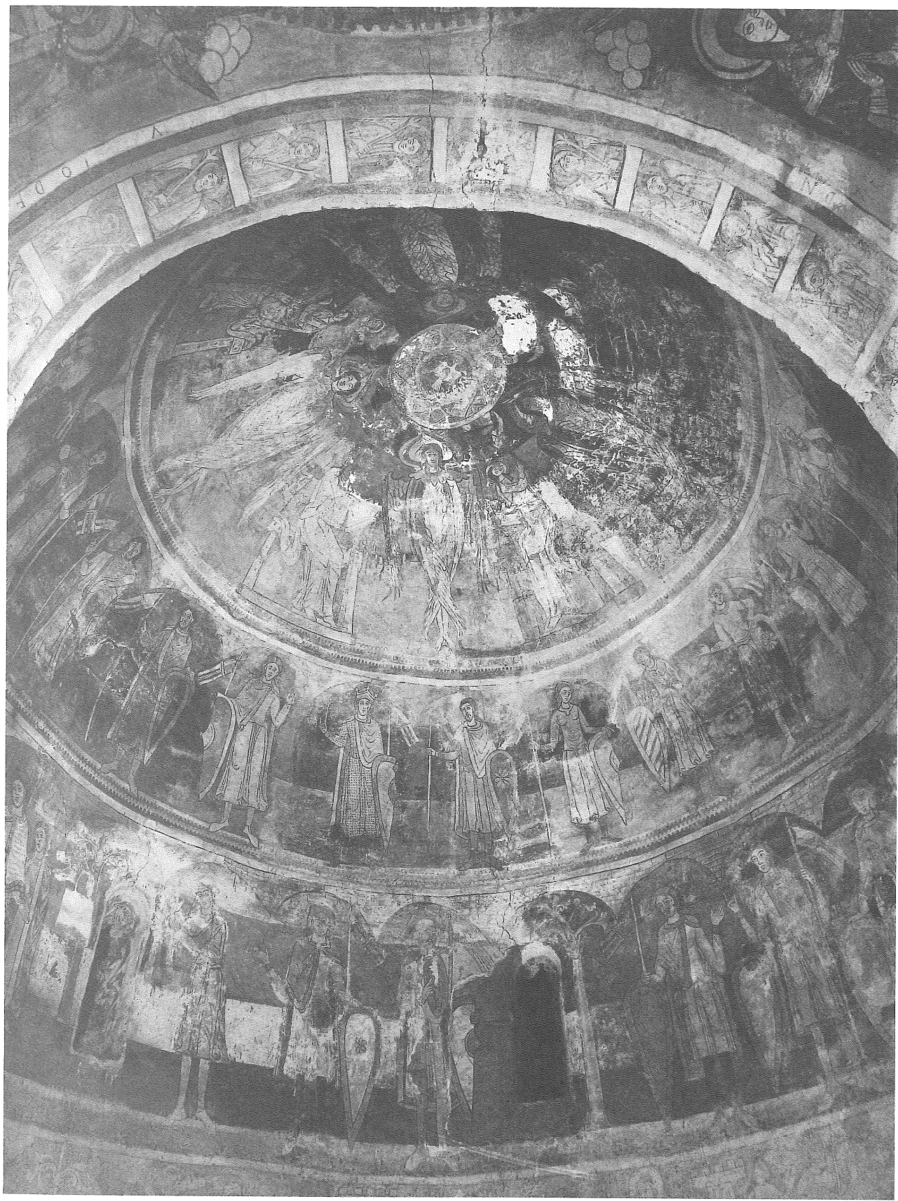
Obr. 55: Stav při odstraňování přemaleb v západní části lodi znojmské rotundy (zóny III, IV, V) na počátku Fišerova restaurování r. 1946 (Fotoarchiv SÚPP Praha 36374)