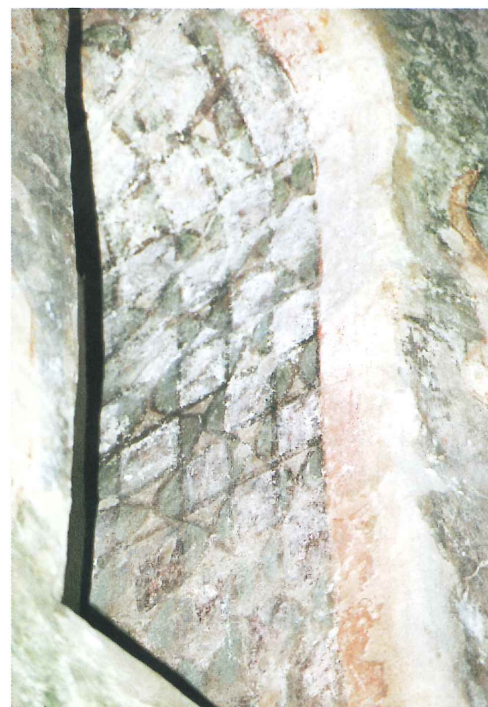
Obr. 93 (nahore): Znojmo, III. zóna — fig. 11 za třetím stromem a fragment fig. 12 (digit. ÚKS AV Praha) Obr. 94 (dole vlevo): Fig. 15 a 16 (digit. ÚKS AV Praha) (dole vpravo): Dekor „dvojité sekery“ ve špaletě jihovýchodního okna lodi