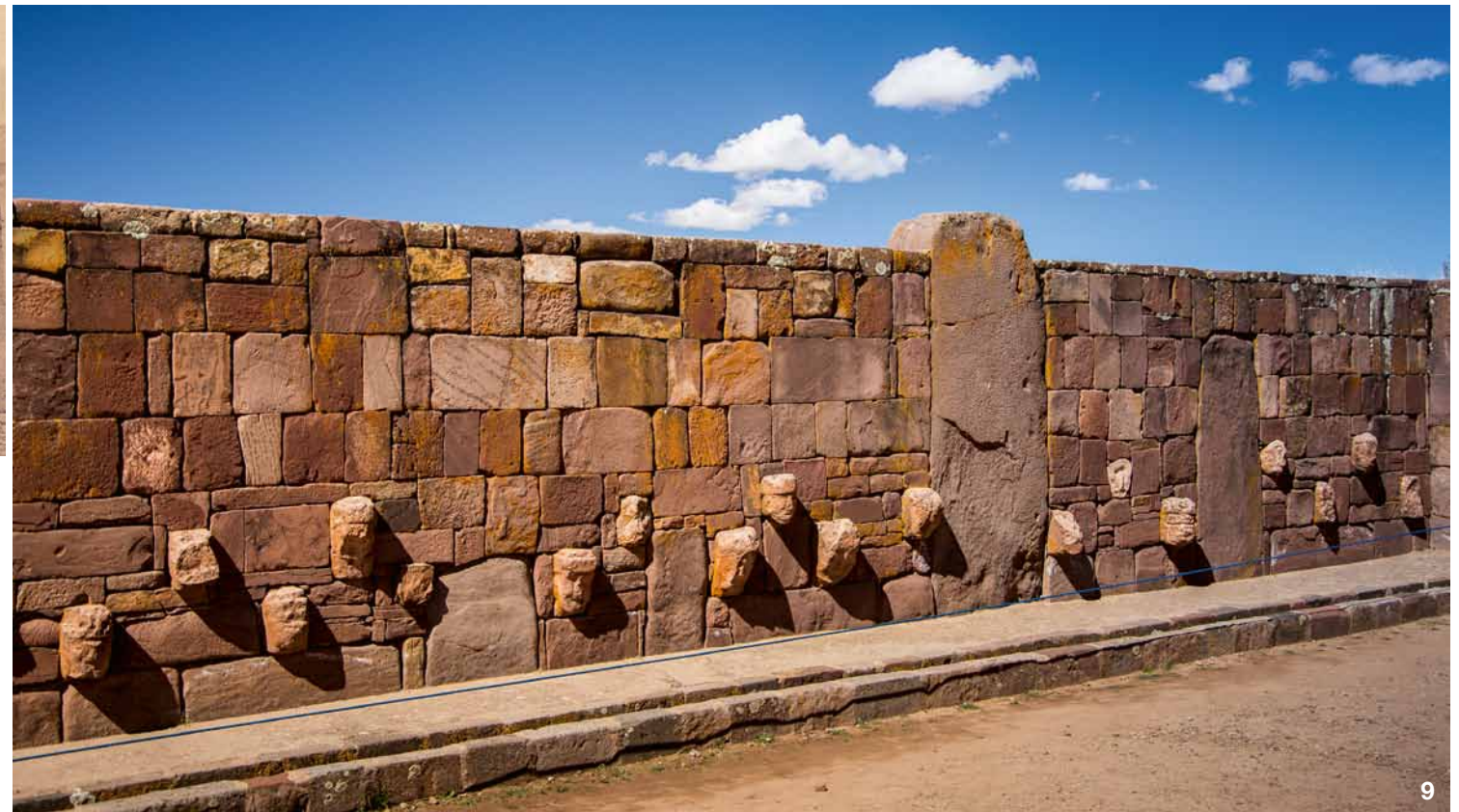
9. ČÁST OBVODOVÉHO ZDIVA Polopodzemního chrámu. 10. CHRÁM KALASASAYA , vlevo Ponceův monolit, vpravo monolit zvaný Mnich (Fraile), také nazývaný Bůh vody, vzadu pyramida Akapana.