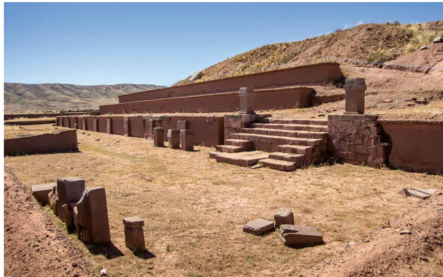
2. PYRAMIDA AKAPANA. Západní strana největší stavby v Tiahuanacu. Původně mohla mít až sedm stupňů a na vrcholu chrám. Zachovala se ale jen spodní část stavby a také kanály na odvod dešťové vody v jejím sousedství, jejichž přítomnost si archeologové v 19. století vykládali jako důkaz existence „podzemního města“ pod dnešními ruinami. Na severní straně byla nalezena obětní keramika, kosti lam, ptáků a morčat v blízkosti rozsekaných lidských pozůstatků. Místnosti domu na vrcholu pyramidy obsahovaly keramiku, kosti lam a kondorů.