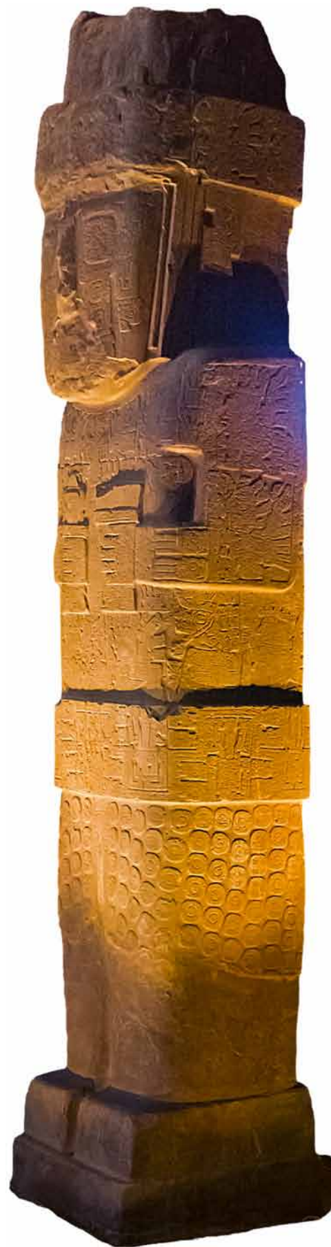
1. BENNETTŮV MONOLIT – nejznámější ze soch nalezených v Tiahuanacu (7,3×1,2 m, 20 tun).

Ve druhé a třetí dekádě 19. století španělské kolonie na celém jihoamerickém kontinentu postupně vyhlásily nezávislost. Nově ustavené státy začaly horlivě budovat příběhy vlastní historie. Svědectví o hlubokých kořenech předkolumbovských civilizací se nabízela