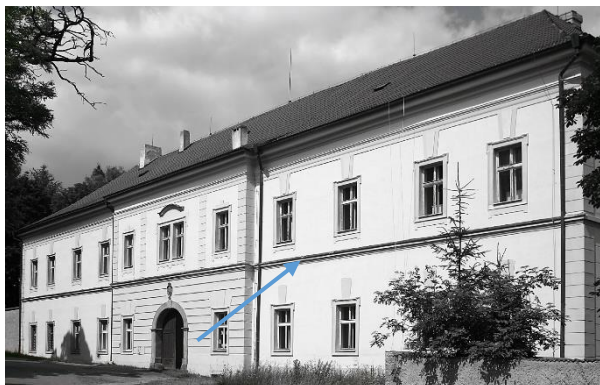
Obrázek 1 Průčelí mšeckého zámku

Stavba byla v historických pramenech poprvé zmíněna již v roce 1548. Ke stavebním úpravám původního zámku posléze došlo na počátku 17. století, kdy měl sídlo v držení Matyáš Štampach ze Štampachu. V přestavbách se poté pokračovalo i v průběhu 18. století, 1 a dnešní podobu zámku lze tedy považovat za příklad barokní stavby.