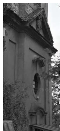
Obrázek 7 Průčelí kostela ve Mšeci