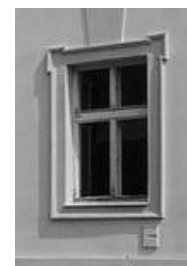
Obrázek 2 Okno mšeckého zámku

2. Jak se nazývá profilované a různě zdobené orámování okenních otvorů na budově mšeckého zámku? Viz obrázek č. 2.