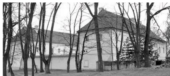
Obrázek 3 Pohled na mšecký zámek