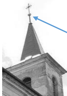
Obrázek 8 Věž kostela v Pozdni