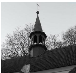
Obrázek 4 Střecha kostela Nejsvětější Trojice v Srbči