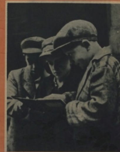
Po vyučování si hoří ještě rychle zopakují úkoly, které mají vypracovat.