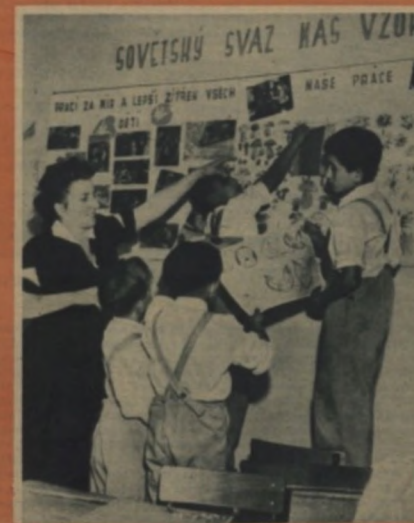
Na nástěnce vystavují malí cikápková nejlepší výkresy.