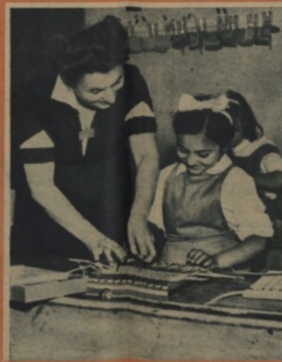
Chvilka ruční práce s líčkem je pro děti velkou záburou.