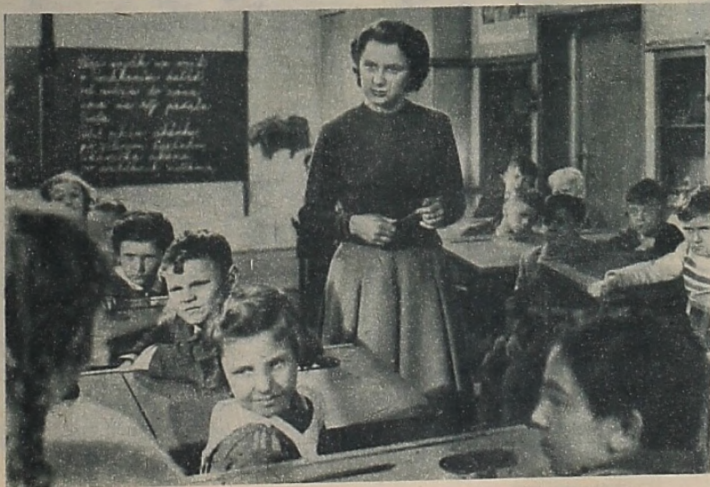
Postavu učitelky vytvořila ve filmu o cikánech herečka Věra Bublková.