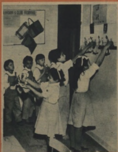
Po příchodu do školy si děti umyjí zuby a ruce.