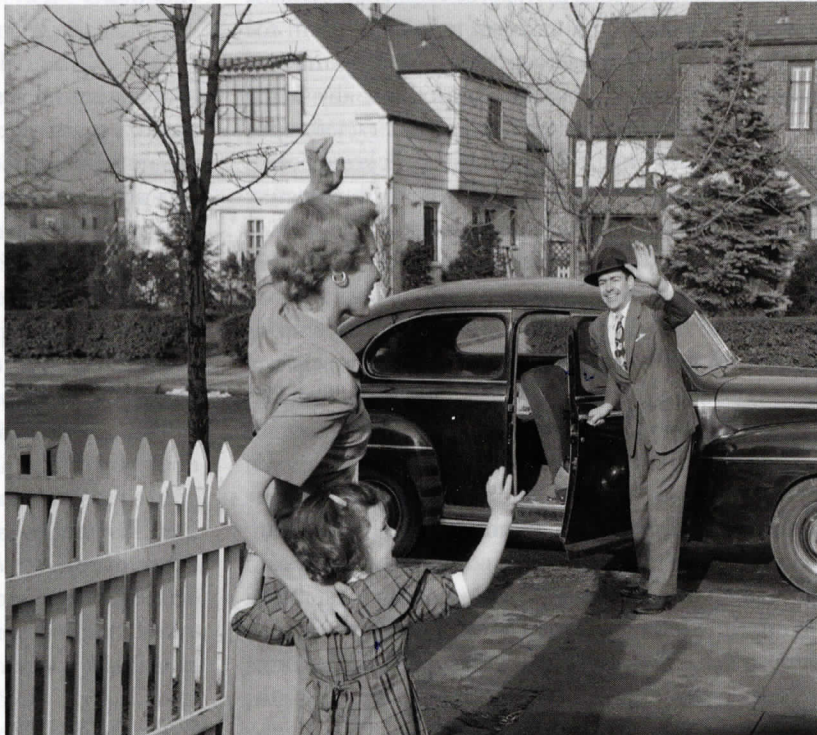
Nesezdání jsou „nemocní“, „nemorální“, „neurotičtí“. Naopak takto vypadá ideální rodina. (Padesátá léta)