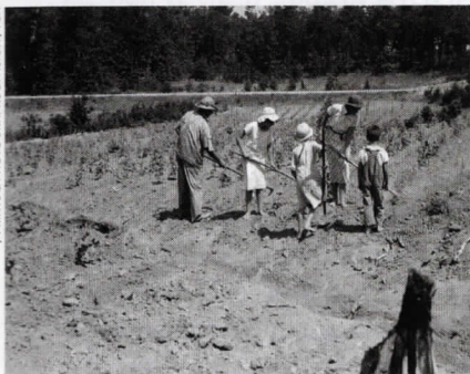
Až dospějí, opustí farmu a vydají se za svým americkým snem. (Děti spolu s rodiči na bavlníkovém poli, Alabama, 1936)