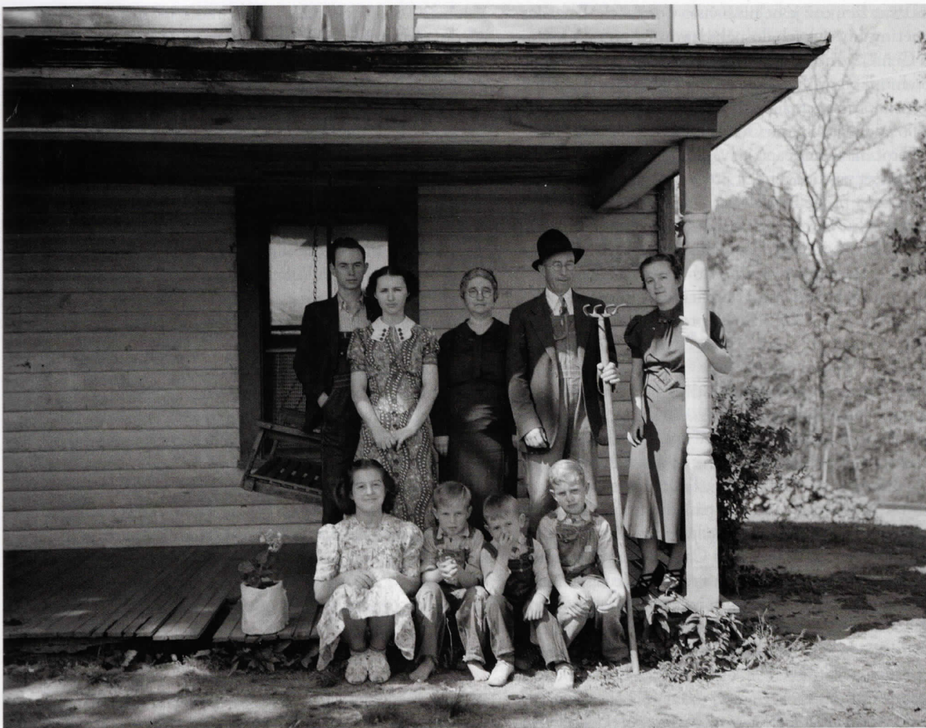
Úpadek mnohogeráčnických rodin přesně kopíruje úpadek práce v zemědělství. (Farmářská rodina ze Severní Karolíny, 1938)