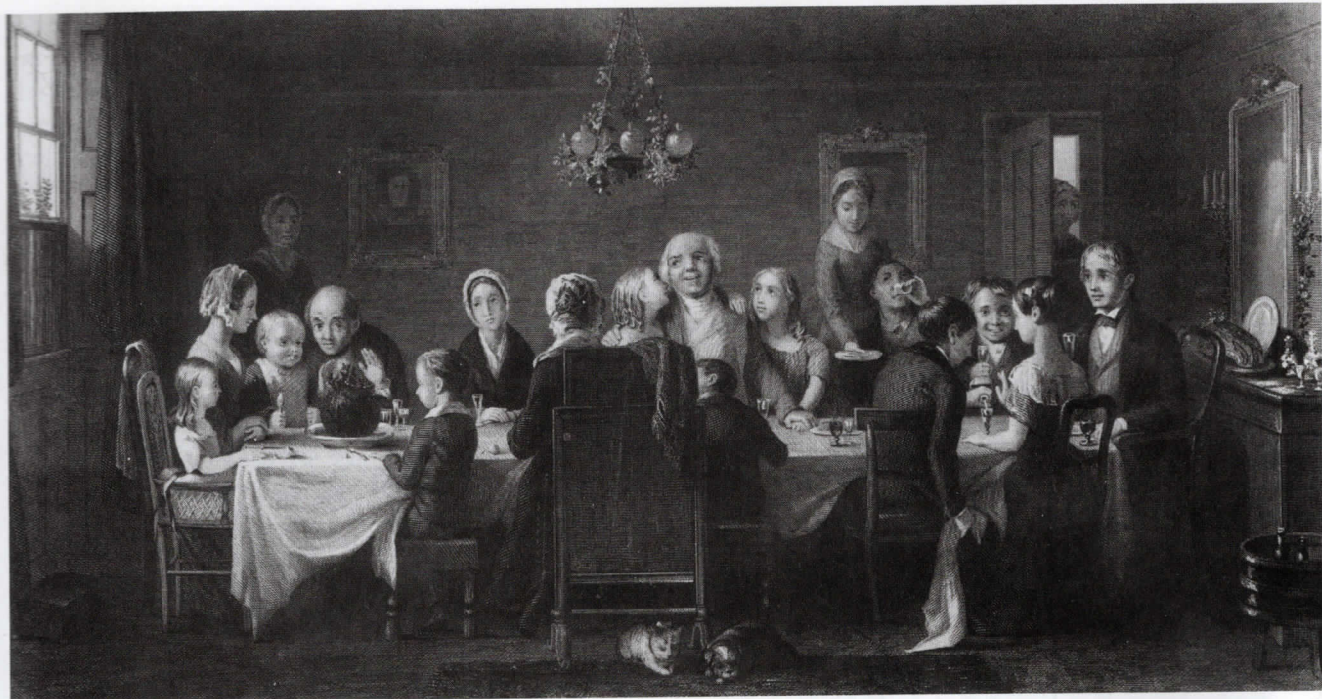
„Rodinný krb“ coby kulturní ideál. (Viktoriánská rodina nad tradičním vánočním pudinkem na obraze Williama Ridgwaye, šedesátá léta 19. století)

nevybrali. Širší rodiny jsou stabilnější a to znamená také méně mobilní. Rodinné vazby jsou pevnější, individuální volby ale naopak více omezené. Je tu podstatně méně místa pro individuální životní styl. Ve viktoriánské éře byly rodiny patriarchální a obecně preferovaly muže, především pak prvorozené syny.