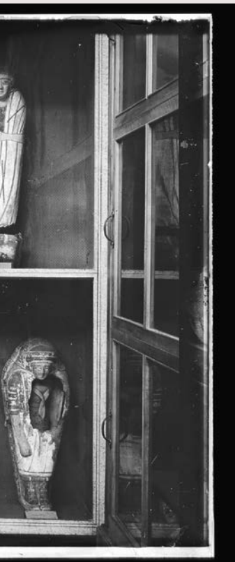
LIBRARY OF CONGRESS, WASHINGTON, D.C.