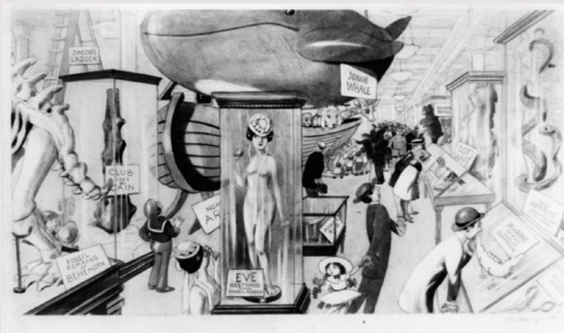
Velryba se od 19. století stala součástí nejedné muzejní expozice. Zde na karikatuře Olivera Herforda.

V současné chvíli probíhají po celém světě debaty o definici muzea a národní i mezinárodní výbory ICOM připravují pro své členy různá dotazníková šetření. Český výbor uvítal iniciativu muzeologů z Masarykovy univerzity, kteří budou moderovat debatu o definici muzea na národní úrovni. V únoru a březnu 2021 připravili dotazník, o jehož vyplnění jsme žádali muzejní zaměstnance, pracovníky univerzitních a akademických pracovišť i zástupce zřizovatelů. Dotazník vyplnilo 499 respondentů, z nichž 73 % tvoří zaměstnanci