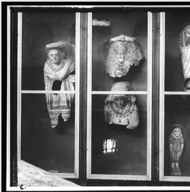
Egypt, pravděpodobně muzeum v Káhiře (mezi lety 1898 a 1946)

„Muzeum je nezisková, permanentně působící instituce ve službách společnosti a jejího rozvoje, otevřená veřejnosti, která získává, uchovává, odborně zpracovává, zprostředkovává a vystavuje hmotné a nehmotné dědictví lidstva a jeho životního prostředí za účelem vzdělávání, studia a potěšení.“