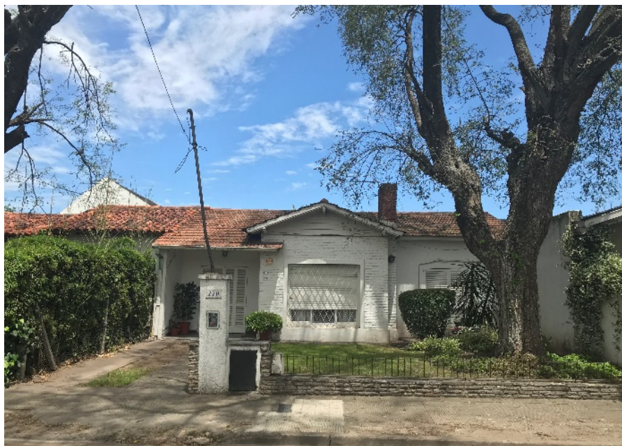
Obr. 3 Původní Zeyenův dům s předzahrádkou a malým plotem.

zahradního města jako celku. V současné době jsou přeměny častější a výraznější. Zásahy jsou nejviditelnější v ulici De las Tipas, ve které nezůstala ani polovina původních domů.