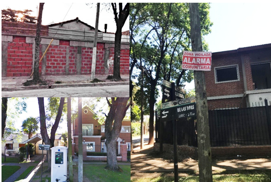
Obr. 4 Materiální symboly nedůvěry v ulici Las Tipas.

Jinou zkušenost s prostorovými změnami v zahradním městě popsala Anita. Sousedsky nepřívětivý charakter ulice Las Tipas se promítl do její každodenní rutiny a ovlivnil tak přímo Anitin tělesně prožívaný a produkováný prostor. Procházky po oblíbených cestách, cvičení jógy v parku, jízda na kole v bezprostředním okolí domova se stane součástí každodenní rutiny, skrze kterou se formuje vztah k místu. Výpověď Anity ilustruje oslabení každodenní rutiny. Procházka, skrze kterou místo prožívá a zakouší, může být vnímána jako tělesně prožívaný i produkováný rituál, skrze který každodenně upevňuje svůj vztah k místu (Low 2017: 95). Narušení takového rituálu může vyústit v pocit odcizení a ohrozit přináležení k místu.