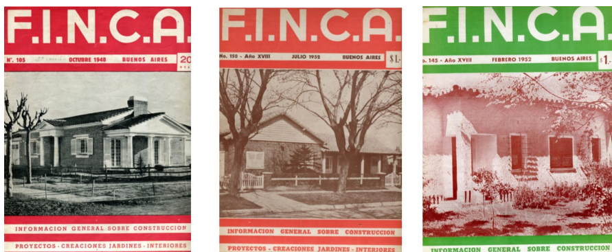
Obr. 2 Časopis stavebního družstva F.I.N.C.A

tel, z čehož 66 % tvořily rodiny zaměstnanců F.I.N.C.A a 13 % obchodníci. 14 Komunita, která se v jednotlivých čtvrtích mezi sousedy utvořila, byla během prvních desetiletí uzavřená a homogenní (Gallanter 2012). Téměř každý znal svého souseda, domy zůstávaly během dne otevřené a sousedé se snažili o udržení bezpečné a přátelské atmosféry ve své čtvrti. Sám Zeyen žil v Lomas del Palomar až do roku 1955, než ho Perónův represivní režim donutil emigrovat do Rakouska. V roce 1960 byla společnost F.I.N.C.A zrušena a jakékoliv další stavební úpravy či rozšiřování města podléhalo pouze správě městské části Palomar.