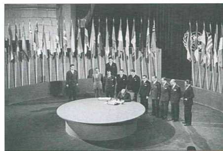
československý ministr zahraničí Jan Masaryk podepisuje Chartu OSN (San Francisco, 26. 6. 1945)

Některé mezinárodní smlouvy slouží k založení mezinárodních organizací . Mezinárodní organizace jsou instituce, které státy zakládají za účelem dosažení společných cílů. Většina organizací má své cíle stanoveny přímo ve svém zakládajícím dokumentu (např. Charta OSN).