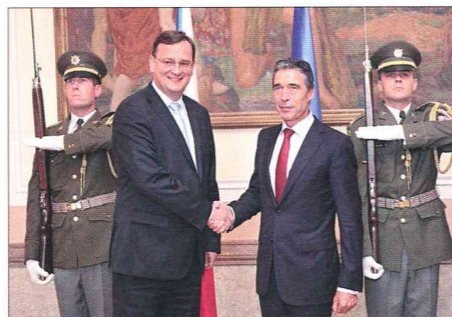
setkání premiéra České republiky a generálního tajemníka NATO (2011)

Stát může díky svému mezinárodnímu uznání vstupovat do vztahů s jinými státy. Tyto vazby označujeme jako mezinárodní vztahy . Státy vytvářením a udržováním mezinárodních vztahů usilují zejména o lepší hospodářský rozvoj , výhodnější obchod nebo snadnější vojenskou obranu .