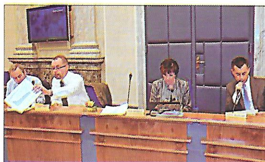
jednání o státním rozpočtu ČR pro rok 2010

Diskutujte o tom, co se financuje z obecního rozpočtu, co ze státního rozpočtu. Odkud tam přicházejí peníze?