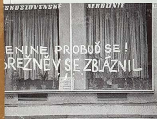
Navždy zapsán v českých srdcích a evropské paměti. Praha, srpen 1968.

po absolvování rostovského zdravotnického učiliště odjela „na umístěnku“ do Tbilisi.