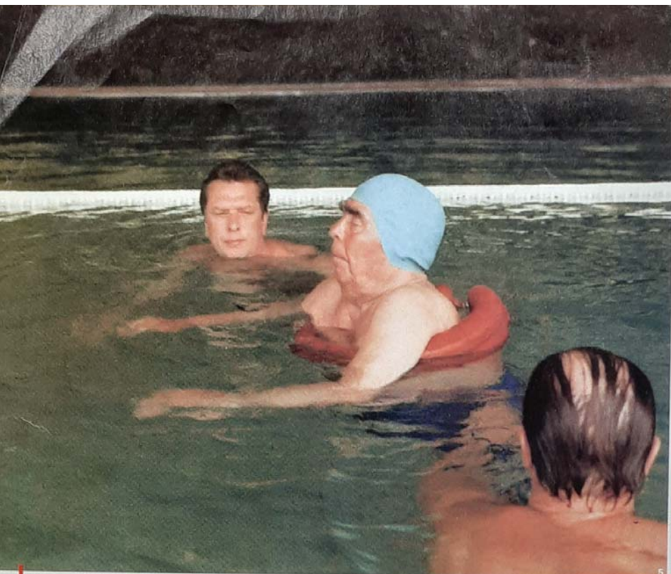
Z posledních dnů Leonida Iljiče. Pod dozorem ochranky v Jaltě na Krymu, srpen 1982.

tánu nebo Saparmurat Nijazov v Turkmenistánu, dnes Otec všech Turkmenů posledly stepním národovectvím.