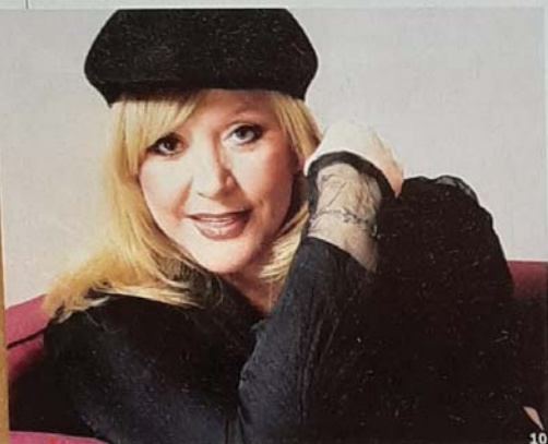
Sovětská kočička. Pěvkyně, herečka, producentka, režisérka a rocková hvězda Alla Pugačová, rok 2002.

Symbolem té doby se stala Džuna, Jevgenije Juvaševna Davitašviliová. Dnes si generálplukovnice lékařské služby říká vládkyně asyrského národa a je zasloužilou členkou 129 akademií věd světa. Dcera kubánské kozačky a přistěhovalce z Íránu