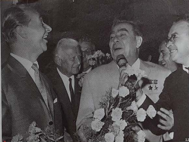
Mezi dobrými přáteli. Úsměvy zleva hýří Alexander Dubček, Ludvík Svoboda a Leonid Brežněv. Komunistický summit v Bratislavě 2. srpna 1968.