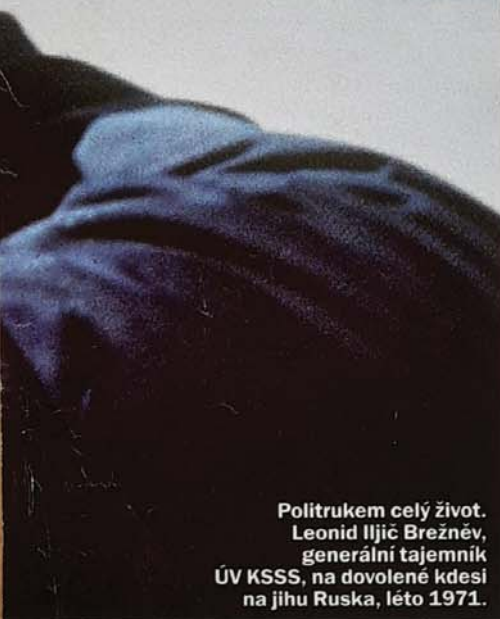
Politrukem celý život. Leonid Iljič Brežněv, generální tajemník ÚV KSSS, na dovolené kdesi na jihu Ruska, léto 1971.

Jeden z nejobávanějších mužů říše zla měl řadu slabostí. V době, kdy „vedoucí silou Sovětského svazu byla leninská strana jako bojový předvoj dělnické třídy a všeho sovětského lidu“, fungovala mezi bolševiky i duchařina.