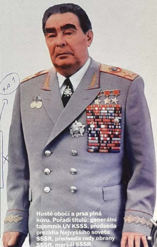
Husté obočí a prsa plná kovu. Pořadí titulů: generální tajemník ÚV KSSS, předseda prezidia Nejvyššího sovětu SSSR, předseda rady obrany SSSR, maršál SSSR.