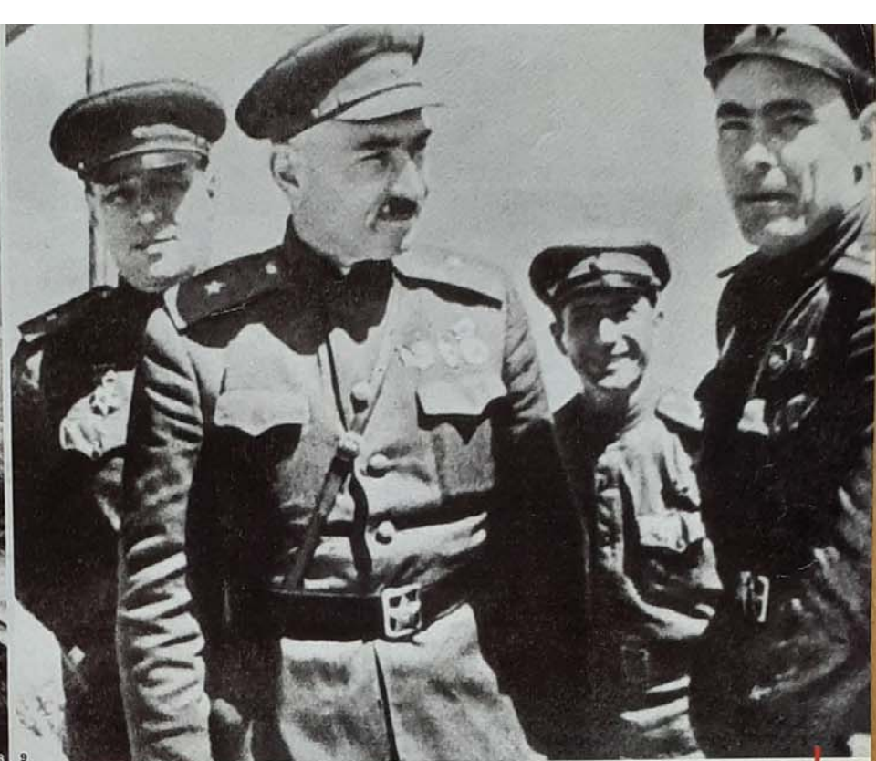
Soudruzi političtí pracovníci Rudé armády. Brežněv (vpravo) při obraně Ukrajiny, léto 1942.