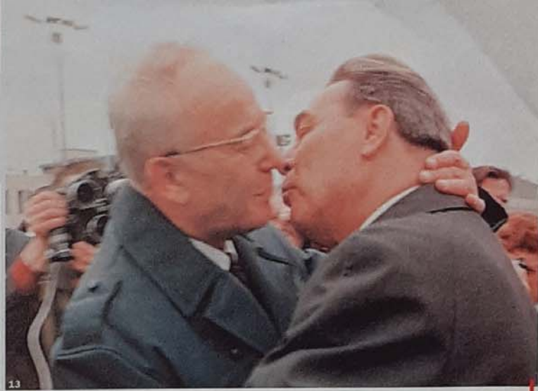
Jidášův polibek. Ještě lepší přítel Gustáv Husák sníval, že by se Slovansko mělo stát součástí Sovětského svazu. Praha, květen 1970.

každá usilovala o moc. V čele jedné z nich stál všemocný, ale smrtelně nemocný šéf KGB Jurij Andropov (1914–1984), jehož konflikt s Brežněvem začal už za Chruščova, do jehož tábora se počítal.