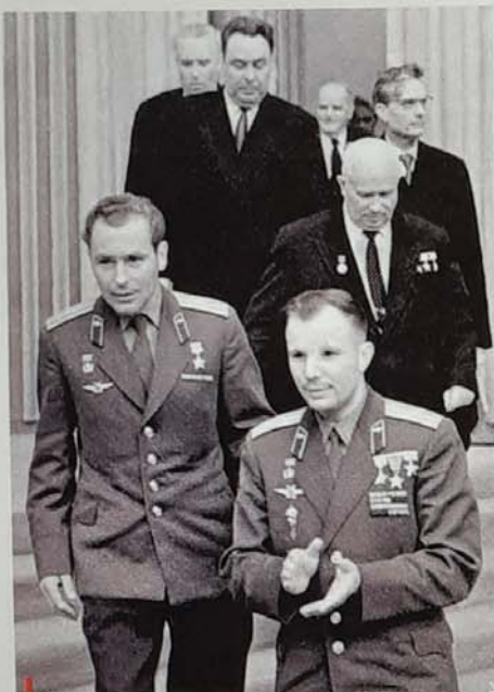
Sovětská chloubka. První a druhý kosmonaut na světě Jurij Gagarin a German Titov (v popředí vlevo), za nimi Nikita Chruščov a Leonid Brežněv, Kreml 1962.