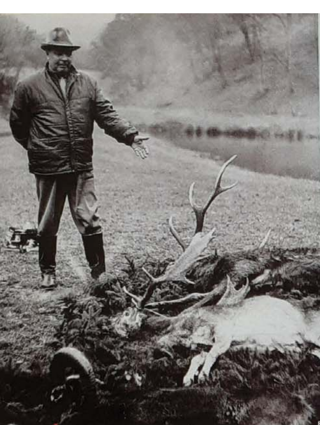
Ostrostřelec a jeho hekatomba. Brežněv na lovu kdesi v Československu, 1967.