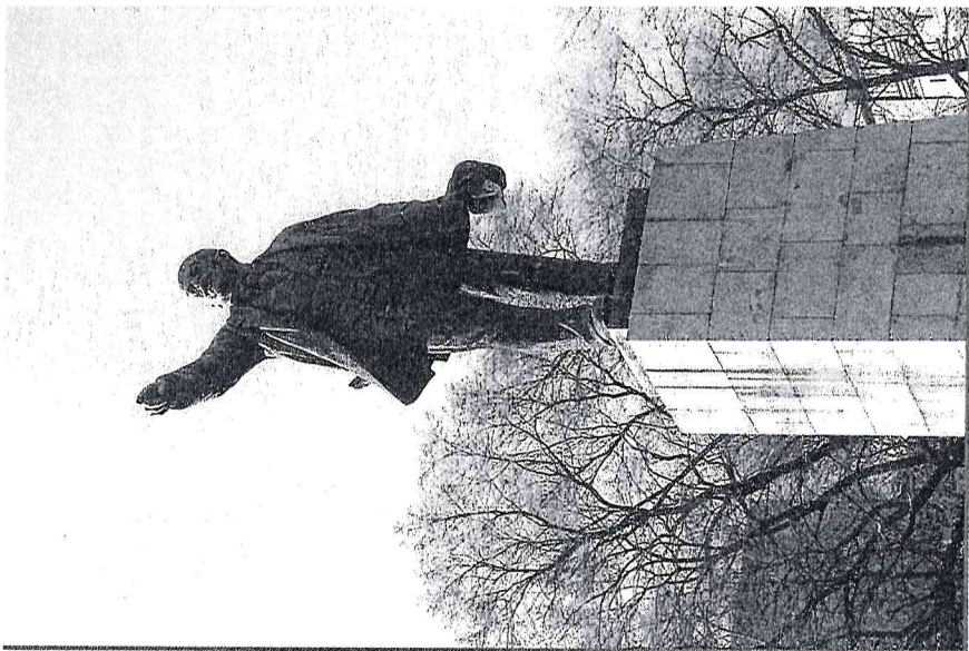
Socha „velkého“ Ulianova je dosud snad ve všech ruských městech