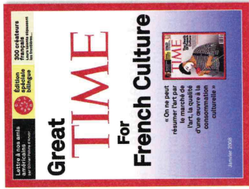
Great Time for French Culture, publication de CultureFrance en réaction à la parution d'un article annonçant la « mort de la culture française » dans l'édition européenne du magazine Time fin 2007.

Dans une longue enquête intitulée « La mort de la culture française », Donald Morrison dresse un constat sévère sur la production culturelle de l'Hexagone. « Personne ne prend la culture plus au sérieux que les Français », note pourtant le journaliste. [...] Autrefois admirée pour l'excellence de ses écrivains, artistes et musiciens, la France est aujourd'hui une puissance vieillissante sur le marché mondial de la culture », ajoute le Time . [...] « Comment la France pourrait-elle redevenir un géant culturel ? » C'est la question que pose Donald Morrison à la fin de son réquisitoire. « Le pays pourrait peut-être retrouver sa grandeur perdue grâce à ses minorités, pleines d'ambition et de colère, qui s'investissent dans la culture aux quatre coins du pays. Ces minorités transformant la nation française en un grand bazar multiculturel fait d'art, de littérature et de musique. »