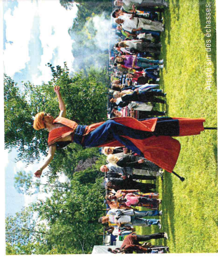
Artistes sur des échasses.