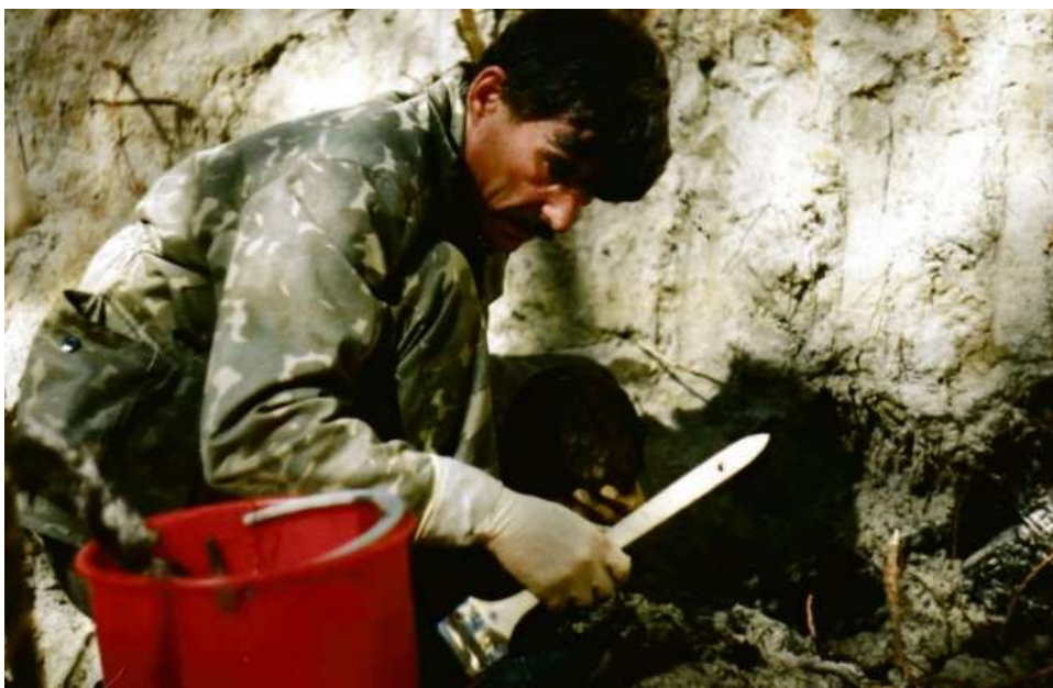
Historik Jurij Dmitrijev v roce 2005 při práci – vykopávání utajených hrobů obětí stalinských poprav.

Něco se děje, pochopil Dmitrijev. „Bud’ mě zavřou, nebo zabijou,“ řekl svému příteli Juriji Cvibelovi. Půl roku nato mu nasadili želízka.