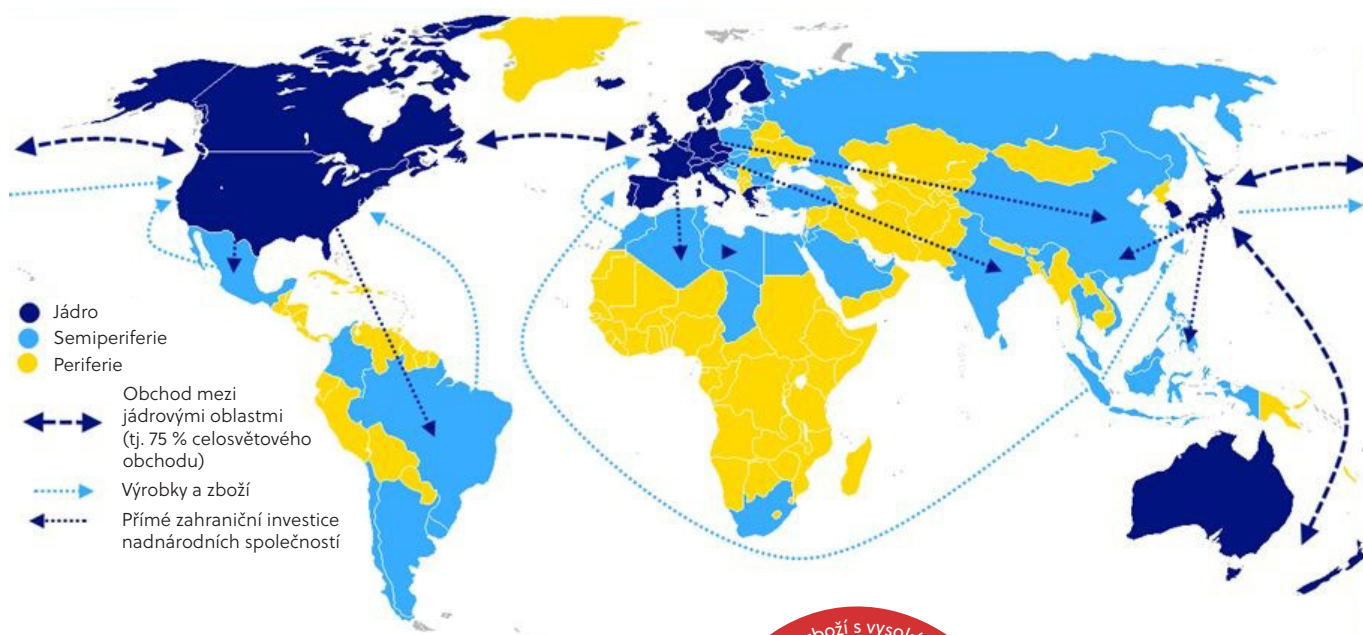
OBR. 1 Světový systém a model jeho fungování podle Wallersteina (2004)