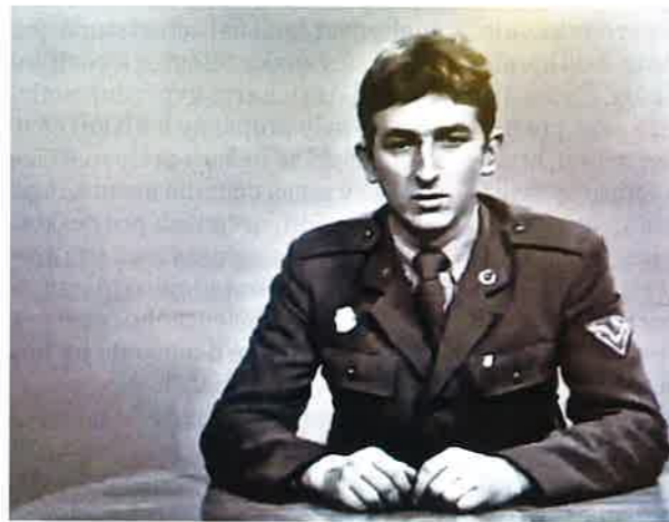
Fotografie z televizního vystoupení vojáka ČSLA a „ženy z lidu“ k Antichartě z nesestříhaných materiálů ČST nalezených v archivu ORF ve Vídni