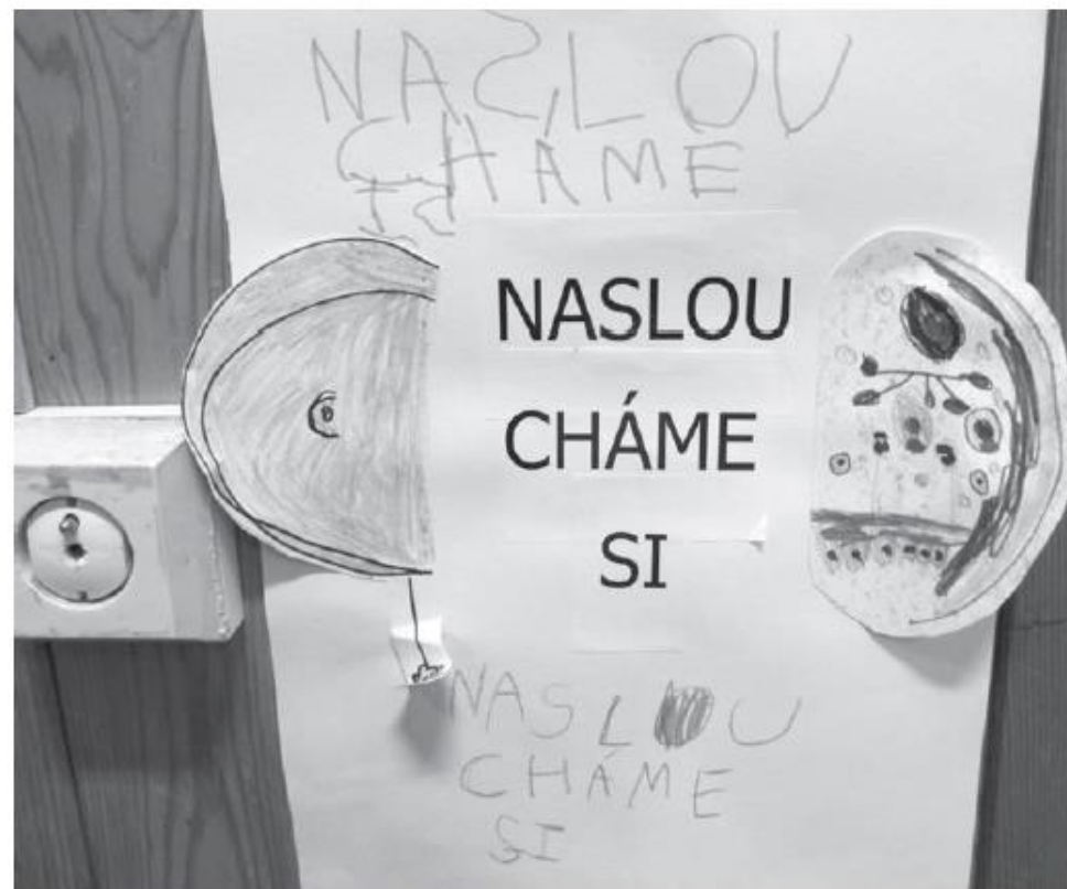
Obr. 11 Pravidla tvořená ve spolupráci s dětmi