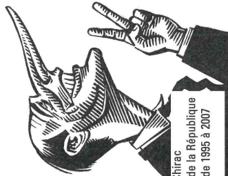
Jacques Chirac président de la République française de 1995 à 2007 par Honoré