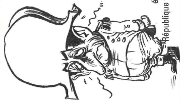
Nicolas Sarkozy élu président de la République française en 2007