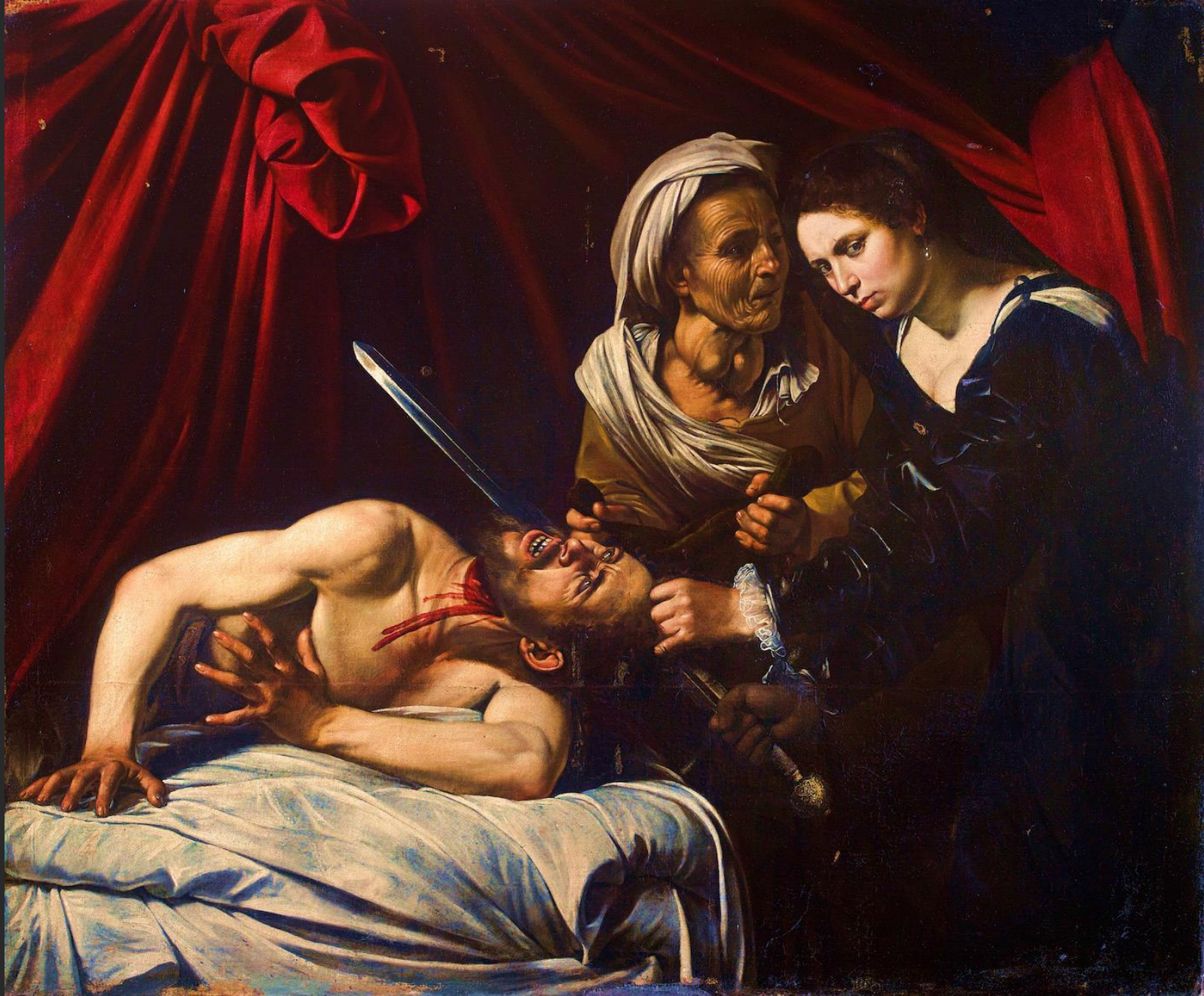
Judita a Holofernes , asi 1599, Řím, soukromá sbírka, Toulouse