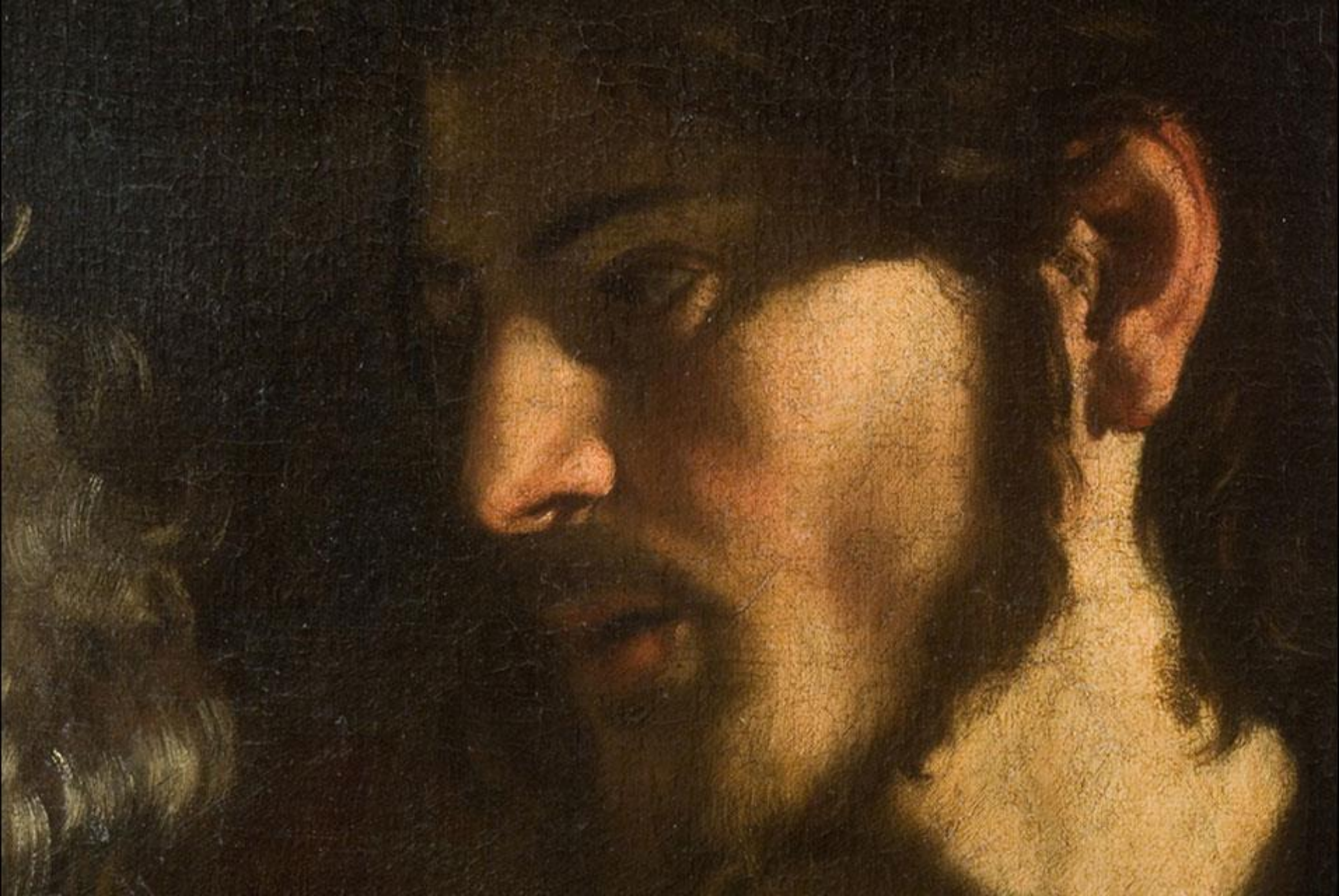
Povolání sv. Matouše , červenec 1599 – červenec 1600 Řím, kostel San Luigi dei Francesi, kaple Contarelli, detail