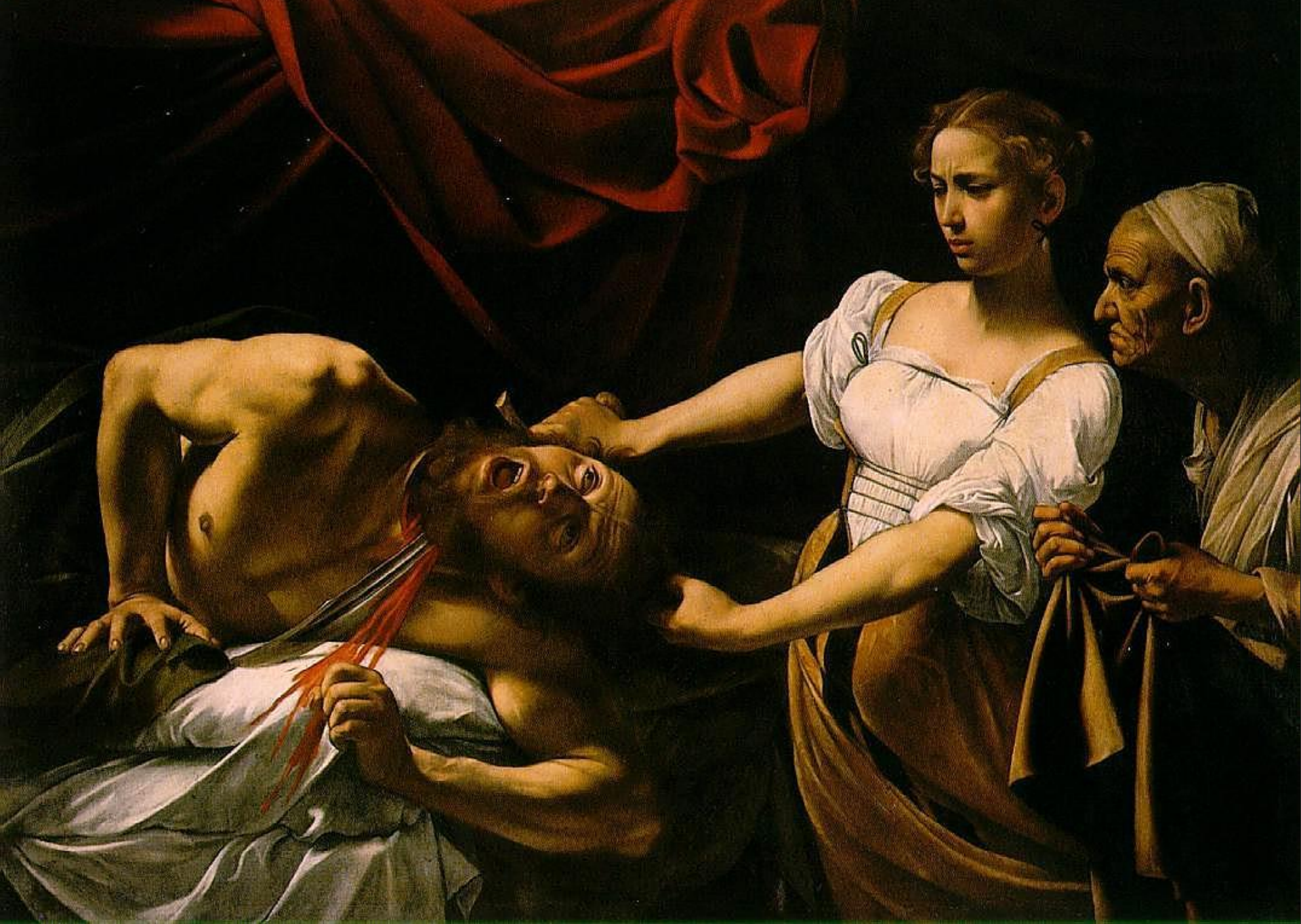
Juditha a Holofernes , 1599, Řím, Galleria Nazionale, Palazzo Venezia