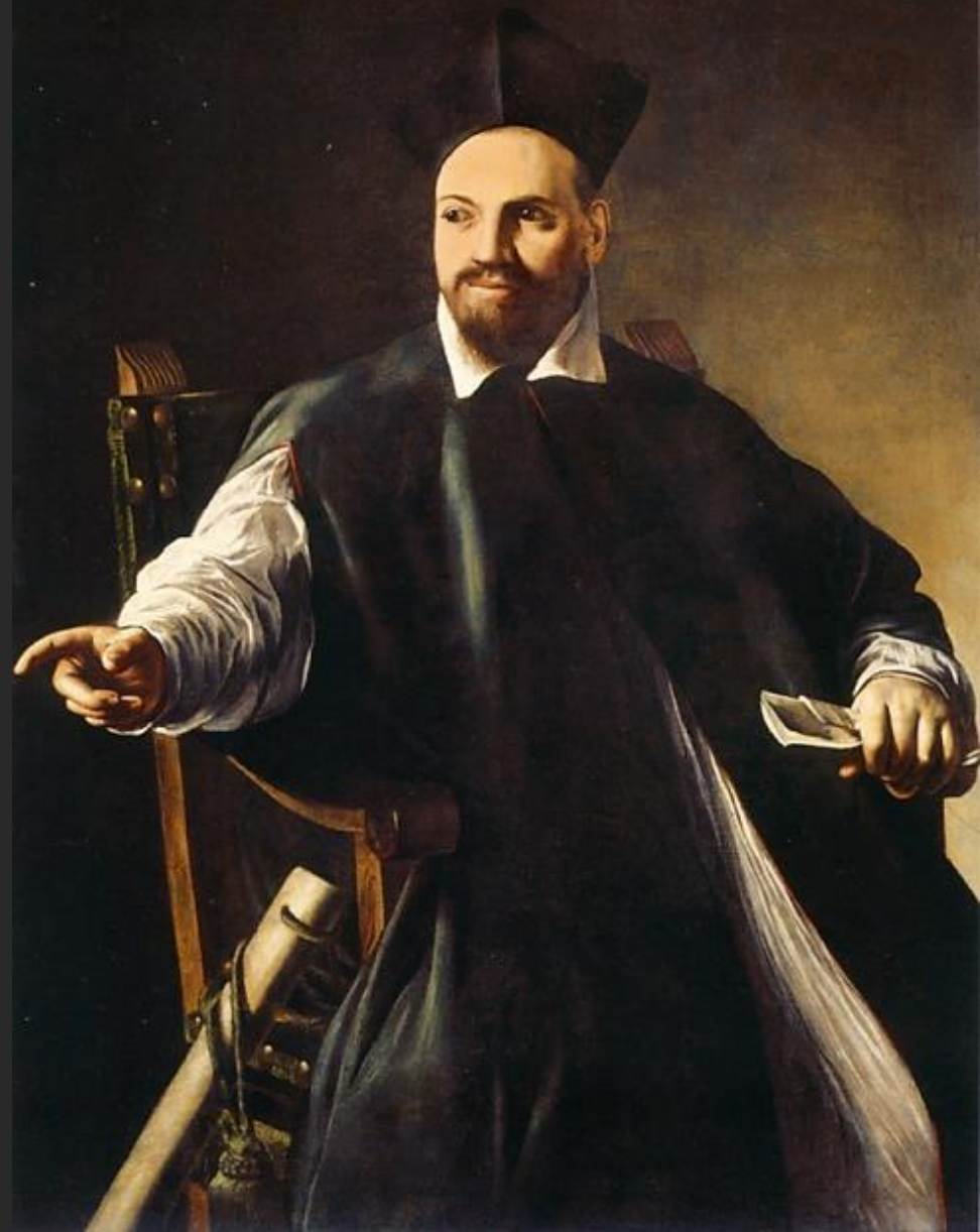
Maffeo Barberini , asi 1596

Do Accademia dei Insensati dochází i básník a kardinál Maffeo Barberini , pozdější papež Urban VIII . Společnost pěstuje poezii na témata malířství a povzbuzuje malířskou tvorbu na literární témata, například zřejmě Caravaggiova díla na moralistně pojímané náměty, plné úkladů a lásky s postavami chlapců a dívek.