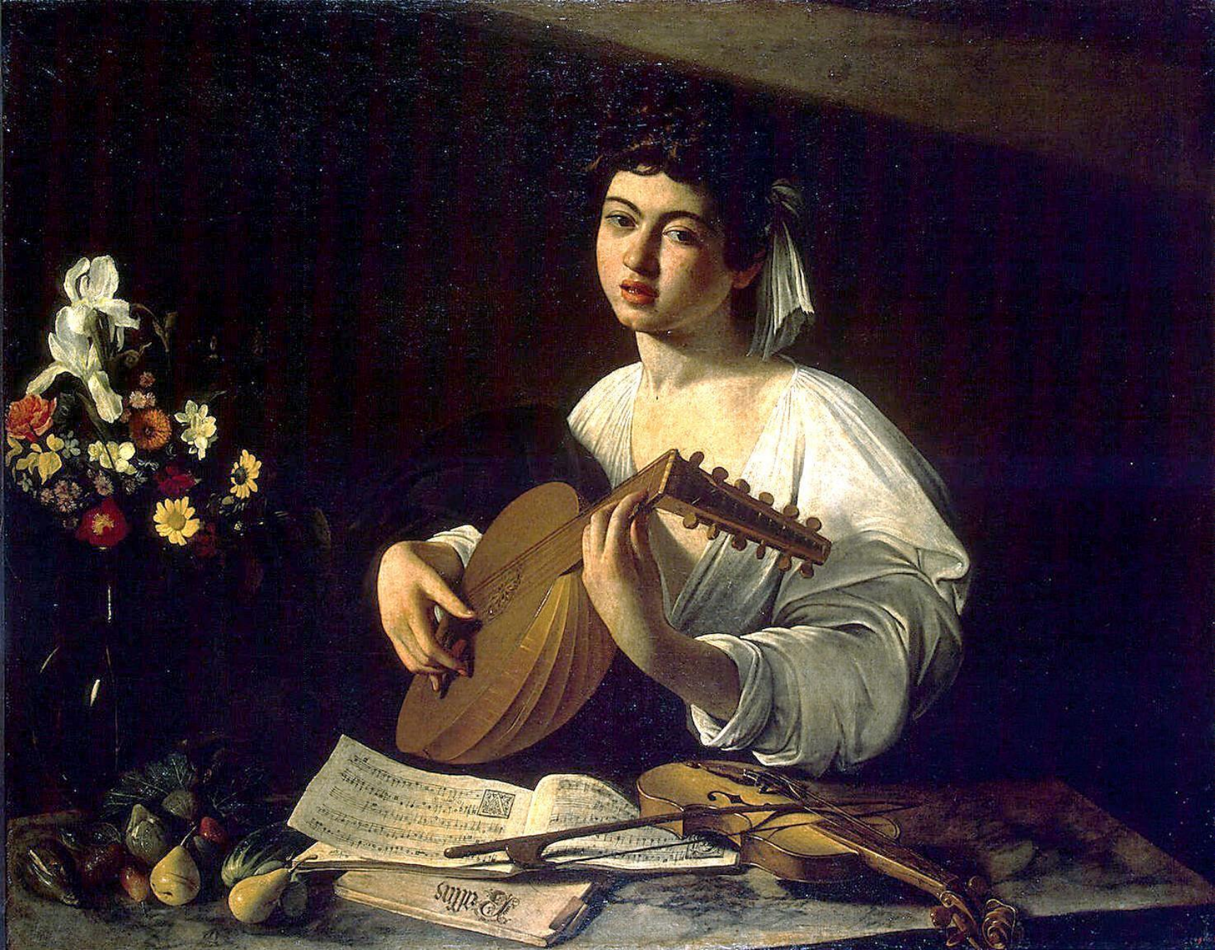
Loutnista , asi 1596, Ermitáž, Petrohrad