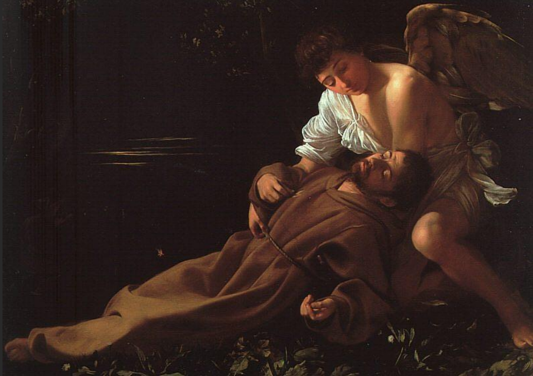
Extáze sv. Františka , kol. 1596, Hartford, Connecticut, Wadsworth Atheneum