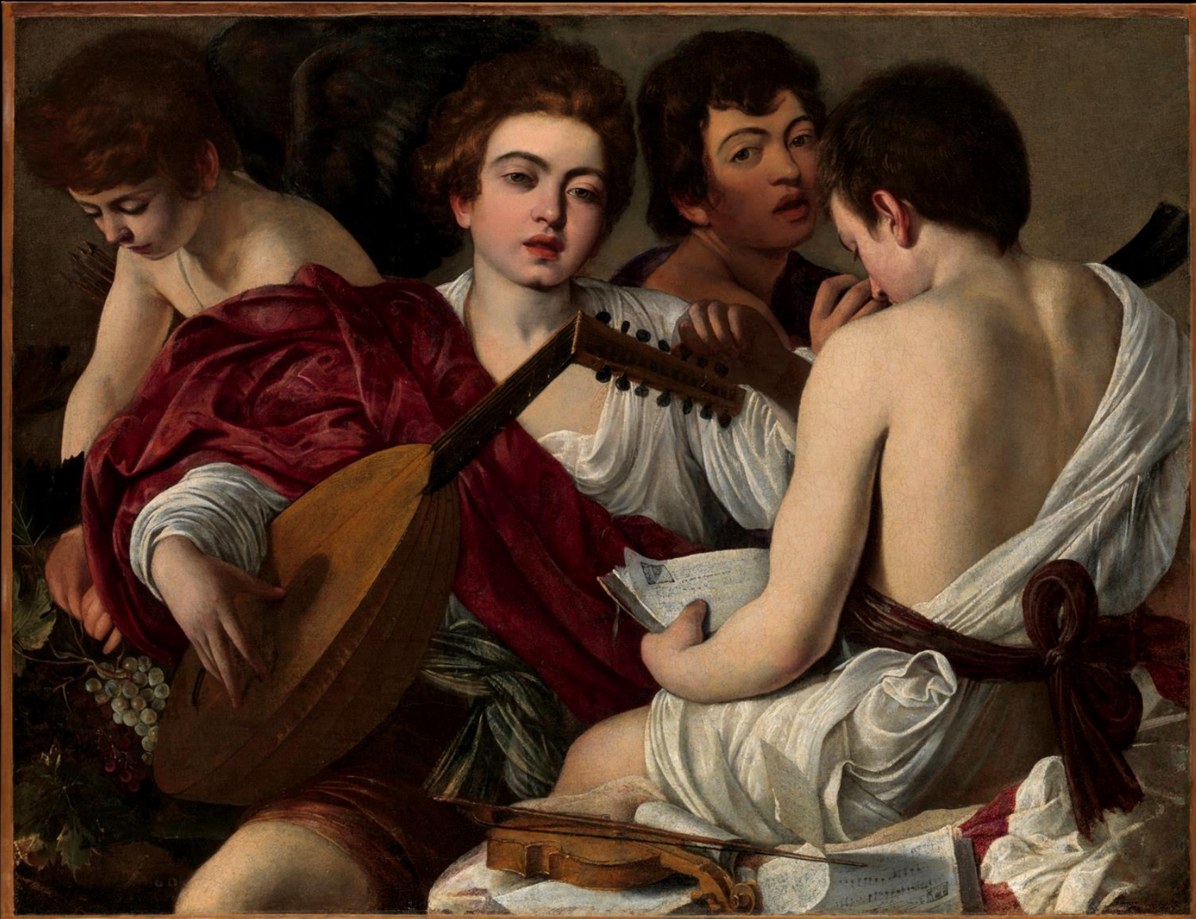
Hudebníci , asi 1596, Metropolitan Museum, New York