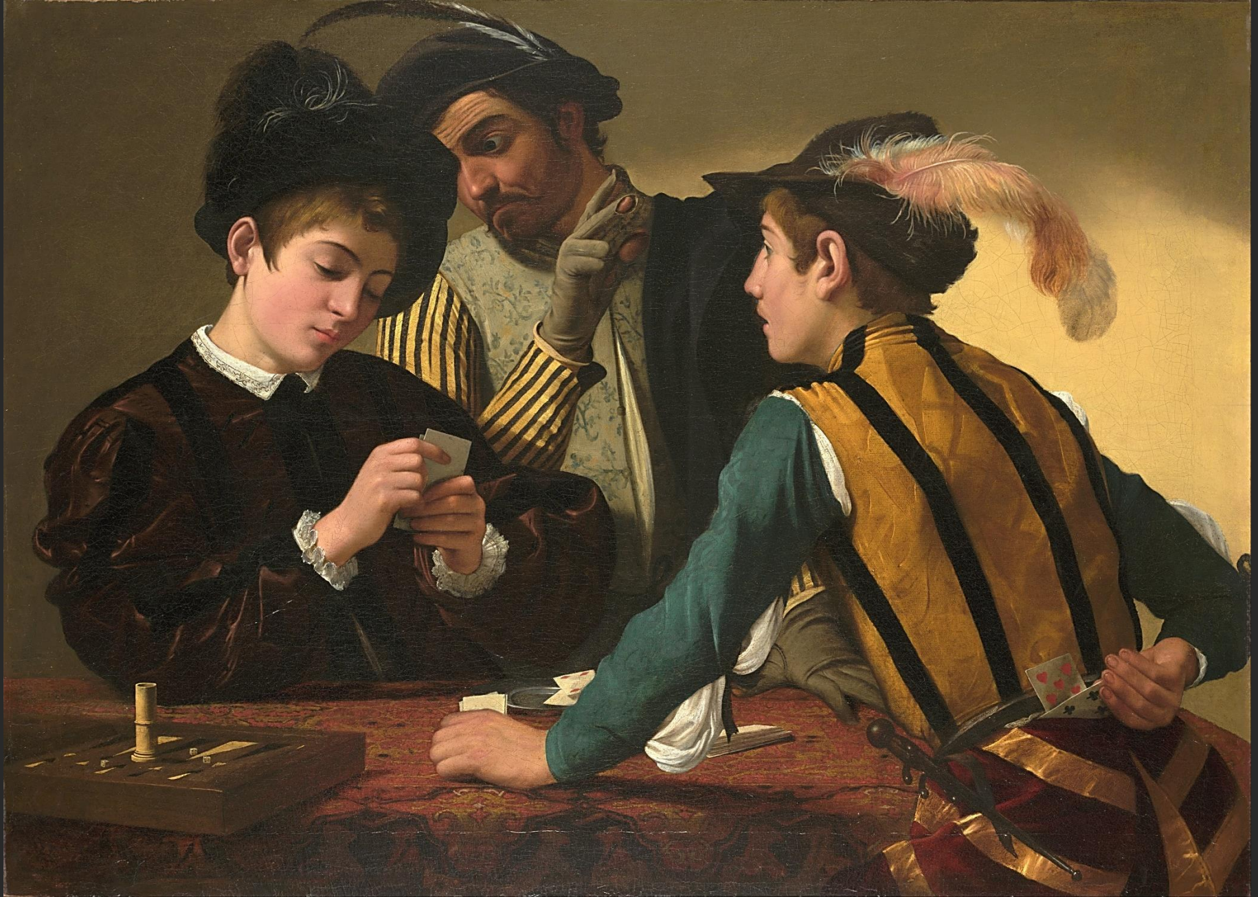
Hráči karet , asi 1596, Kimbel Art Museum, Fort Worth, Texas