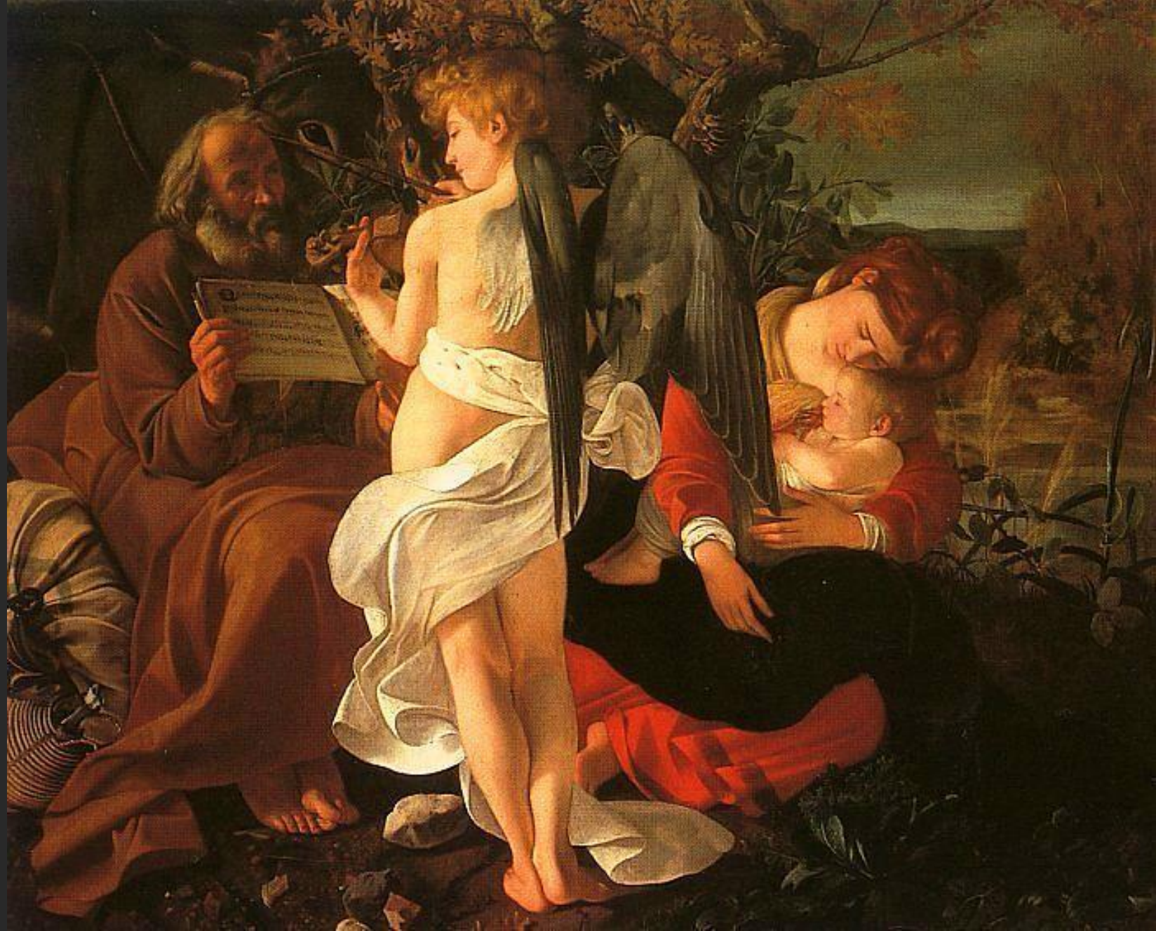
Odpočinek na útěku do Egypta, asi 1596-7, P. Doria-Pamphilij