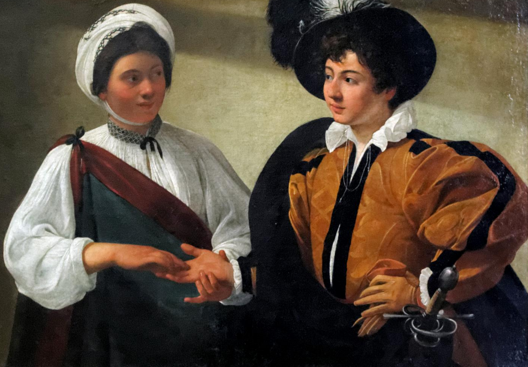
Hadačka , kolem 1596, Paříž, Louvre