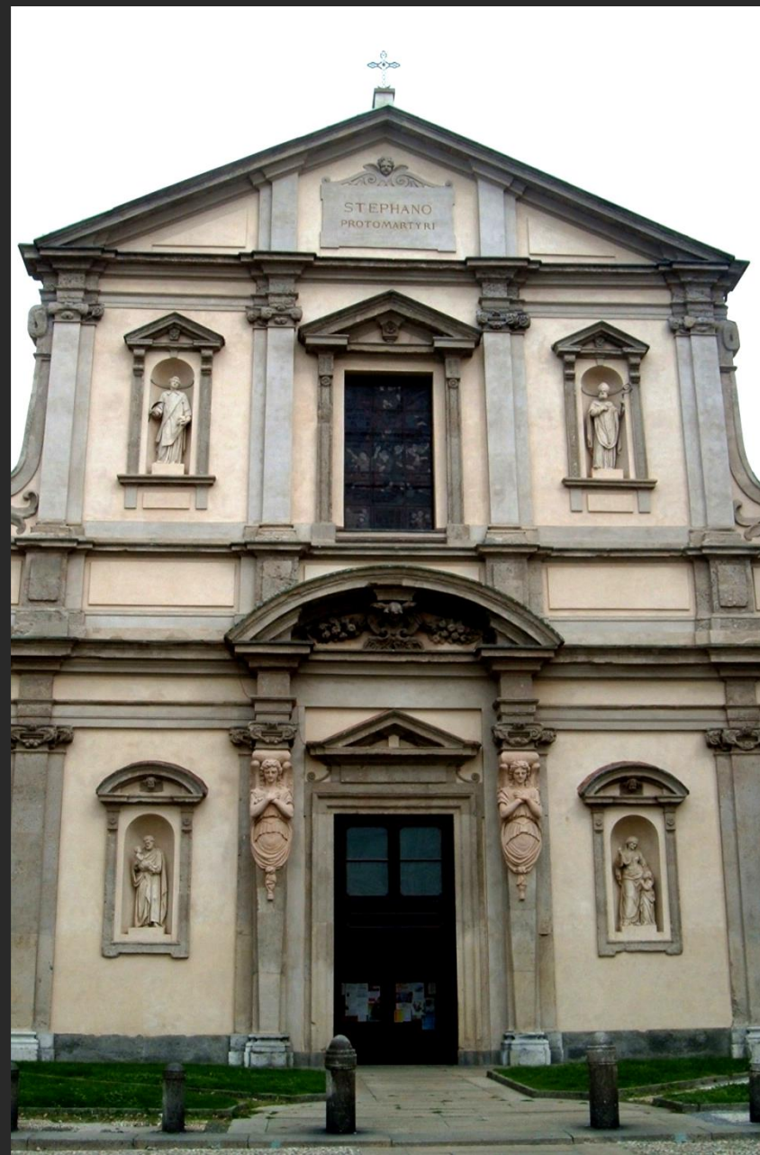
S. Stefano in Brolo , Milán