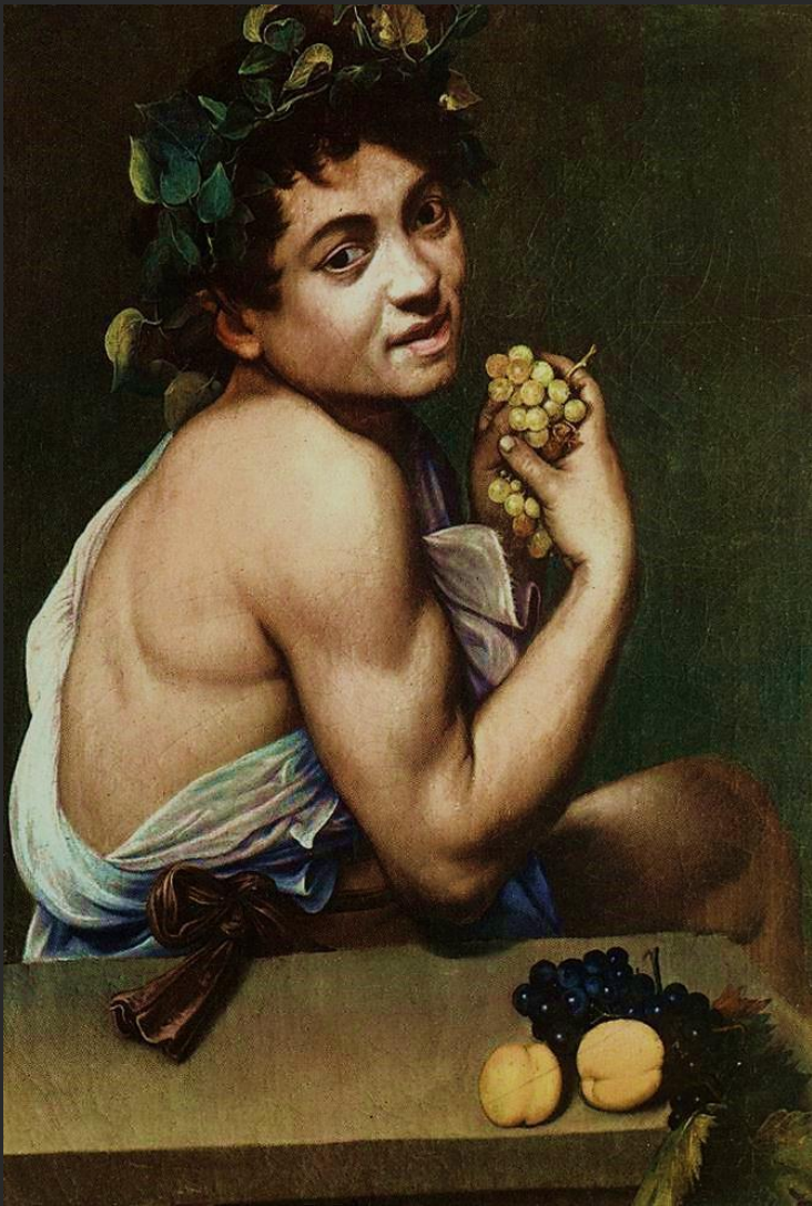
Nemocný Bakchus (Autoportrét) asi 1593-1596 olej, plátno, Galleria Borghese, Řím