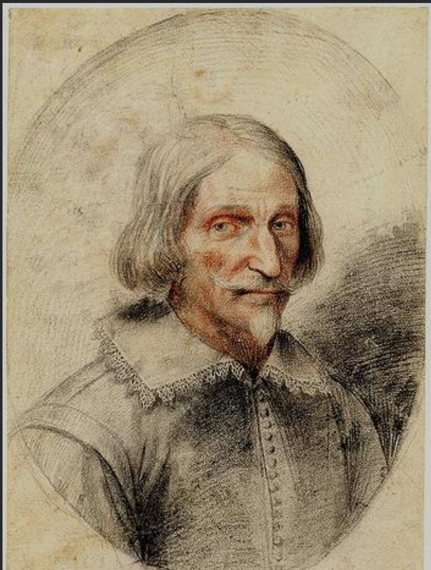
Cavalier d'Arpino, Vlastní podobizna černá křída, rudka, papír

V roce 1592 je papežem zvolen Klement VIII. Aldobrandini a rozvíjí velkorysé stavby Říma. Caravaggio žije ve čtvrti umělců a chudiny mezi chrámem Nejsv. Trojice a náměstím Santa Maria del Popolo. Bydlí nejprve u Pandolfa Pucciho.