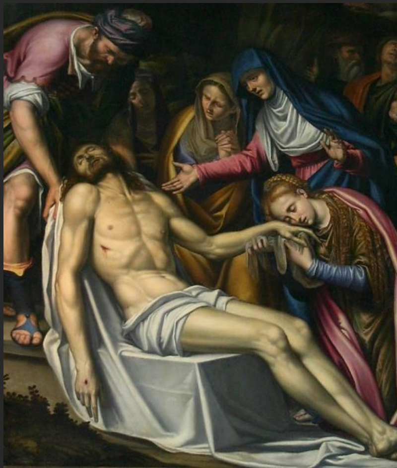
Simone Peterzano, Pieta (Oplakávání) 1584, Milán, kostel San Fedele