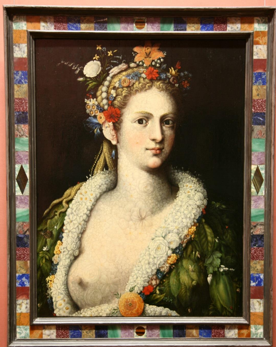
Flóra meretrix , asi 1590