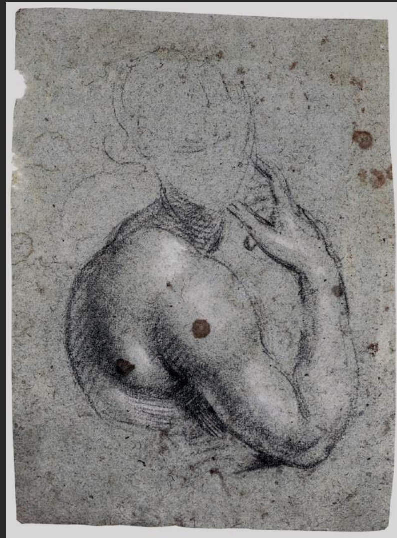
Simone Peterzano podle Michelangela Perská Sibyla , asi 1580, olůvko