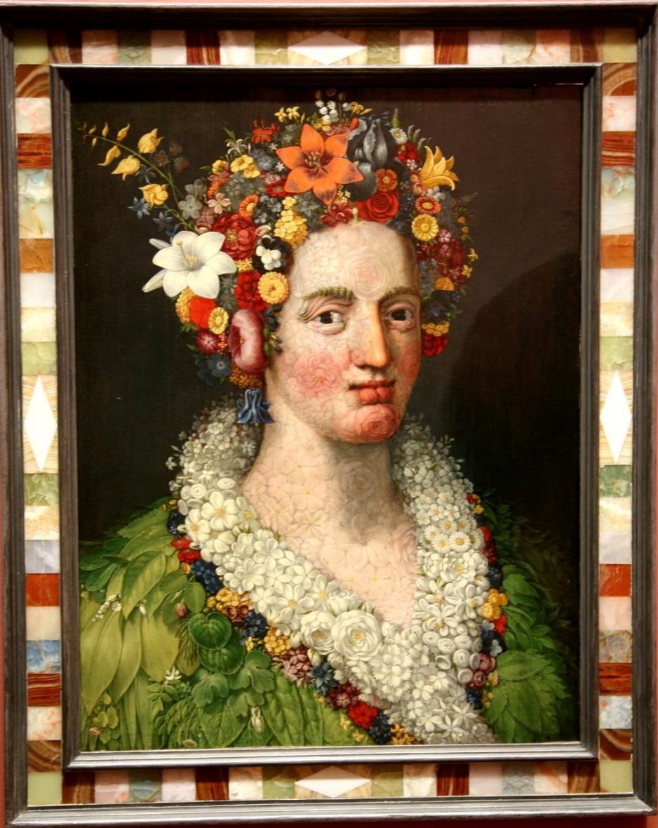
Flóra , 1589