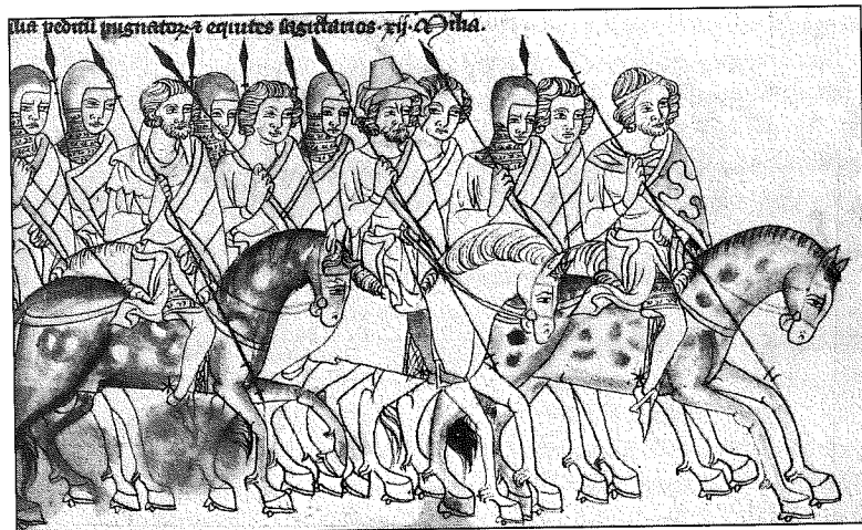
Vojenská tažení a válečné události zaplnily celou první polovinu vlády krále Přemysla. Tak nějak mohli vyhlížet královi bojovníci táhnoucí hned k Rýnu, hned do Durynska, třebaže Velislavova bible tu zobrazuje starozákonní motivy

na to obdarování většinou jen liknavě sloužili „svému“ králi. Principy lenní hierarchie ztrácely obsah. Spolehlivou zárukou nebylo ani příbuzenství. K Filipovi přešel Otův starší bratr Jindřich, rýnský falckrabě, Welfa také opustil kolínský arcibiskup Adolf, duchovní otec jeho volby. Nejedem obrat provedl durynský lantkrabě Heřman, mecenáš rytířské kultury (ta přece stála na zásadách věrnosti), jiní nebyli ani míšeňští Wettinové. 12)