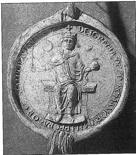
Císařská pečeť Oty IV. Brunšvíckého, přední strana s trůnícím panovníkem, 1209

Brunšvícký žádné překážky upevnování církevního státu, nezajímá ho osud Sicilského království a prokazoval Inocencovi naprostou úctu. V březnu 1209 obnovil ve Špýru své dřívější sliby církvi a stolci sv. Petra, čímž si otevřel cestu k římské korunovační jízdě. Ale v reprezentativně obeslané výpravě chyběl oddíl Čechů. 4. října 1209 dosáhl Ota svého cíle. V bazilice sv. Petra mu vložil Inocenc III. na skráně císařskou korunu. 26)