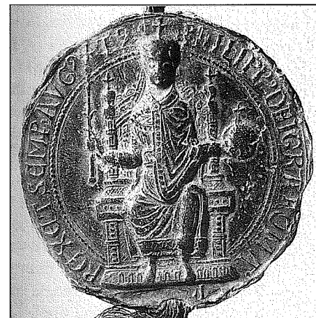
Pečeť krále Filipa Švábského, přední strana s trůnícím panovníkem, 1198

Klid na domácí půdě Přemyslovi umožnil, aby své pozice upevnil také navenek. Obratem rozvinul pražský dvůr čilou zahraniční aktivitu. Pobytem v exilu získal Přemysl orientaci v německých poměrech. Tohoto „informačního náskoku“ uměl pragmaticky využívat. Ačkoliv sám mohl osobně Štaufům leccos zazlívát, politický instinkt ho vedl na jejich stranu. Jako spojenec Filipa Švábského vyrazil Přemysl koncem léta 1198 k Rýnu, aby mu přispěl