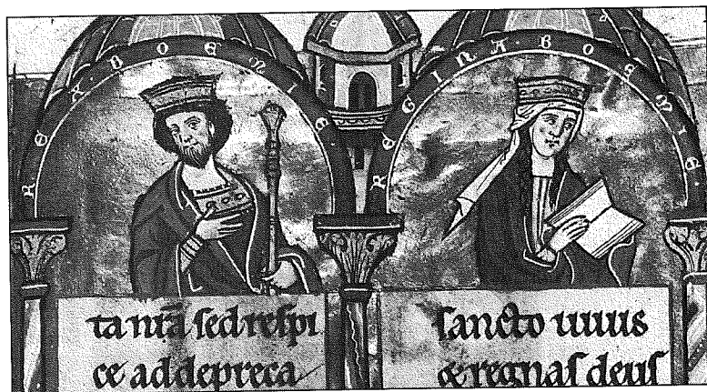
Přemysl Otakar I. a královna Konstancie v žaltáři Heřmana Durynského, který vznikl nejspíše před rokem 1213

Zbytek roku 1212 probíhal za vítězného postupu Fridricha II. Peněžních injekcí, které mu poskytli Kapetovci, využil k upevnění své moci. V prosinci se podrobil nové volbě ve Frankfurtu, na níž se nejspíše účastnil rovněž Přemysl. 50) Vzápětí byl v Mohuči korunován, i když pravé insignie stále držel císař Ota. V únoru 1213 se Přemysl a Vladislav setkali s Fridrichem na sněmu v Řezně. Není jisté, zda složili lenní hold, jistě se však sjednávaly podrobnosti k úplnému zlomení Oty. 51) Přemysl se účastnil i červenového sněmu v Chebu, kde Fridrich II. stvrdil velké ústupky papeži. 52) Na podzim 1213 válčili Čechové i Moravané, vedení králem i markrabětem, v sestavě Fridrichova vojska v Durynsku.