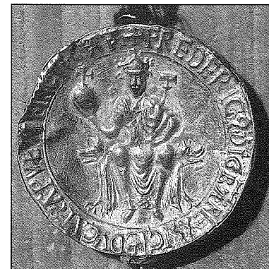
Přední strana zlaté pečeti (buly) s vyobrazením trůnícího Fridricha jako sicilského krále, připojené k Zlaté bule sicilské z 26. září 1212

Proč však Merseburk? Tento opěrný bod říšské moci v „nových“ německých teritoriích sloužil od počátku 11. století jako místo setkávání římských králů a císařů s panovníky východu, hlavně Čech a Polska. Sálci i jejich následovníci tu občas vystupovali v roli arbitrá mezi Přemyslovci a Piastovci, takže Merseburk vidal holdy a jiné ceremonie. Z třístranných schůzek to byla zejména jednání v letech 1046 a 1135. Snad s ohledem na tuto tradici a s vědomím jistých historických „pohledávek“ v piastovském sousedství chtěl Přemysl využít přízně mladého Štaufa, aby zachoval alespoň šance na případnou obnovu jakýchsi nároků v Polsku. Ostatně ať je interpretace merseburské pasáže jakákoliv, plyne z ní jistá nadřazenost českých králů, minulých i budoucích, nad „knížaty Polska“. Možná si chtěl Přemysl zajistit také účast na případných bilaterálních říšsko-polských jednáních s tím, aby