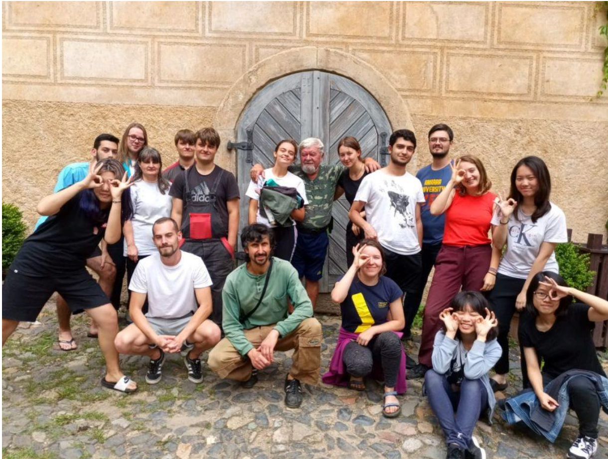
SH Grabštejn, mezinárodní workcamp, INEX-SDA