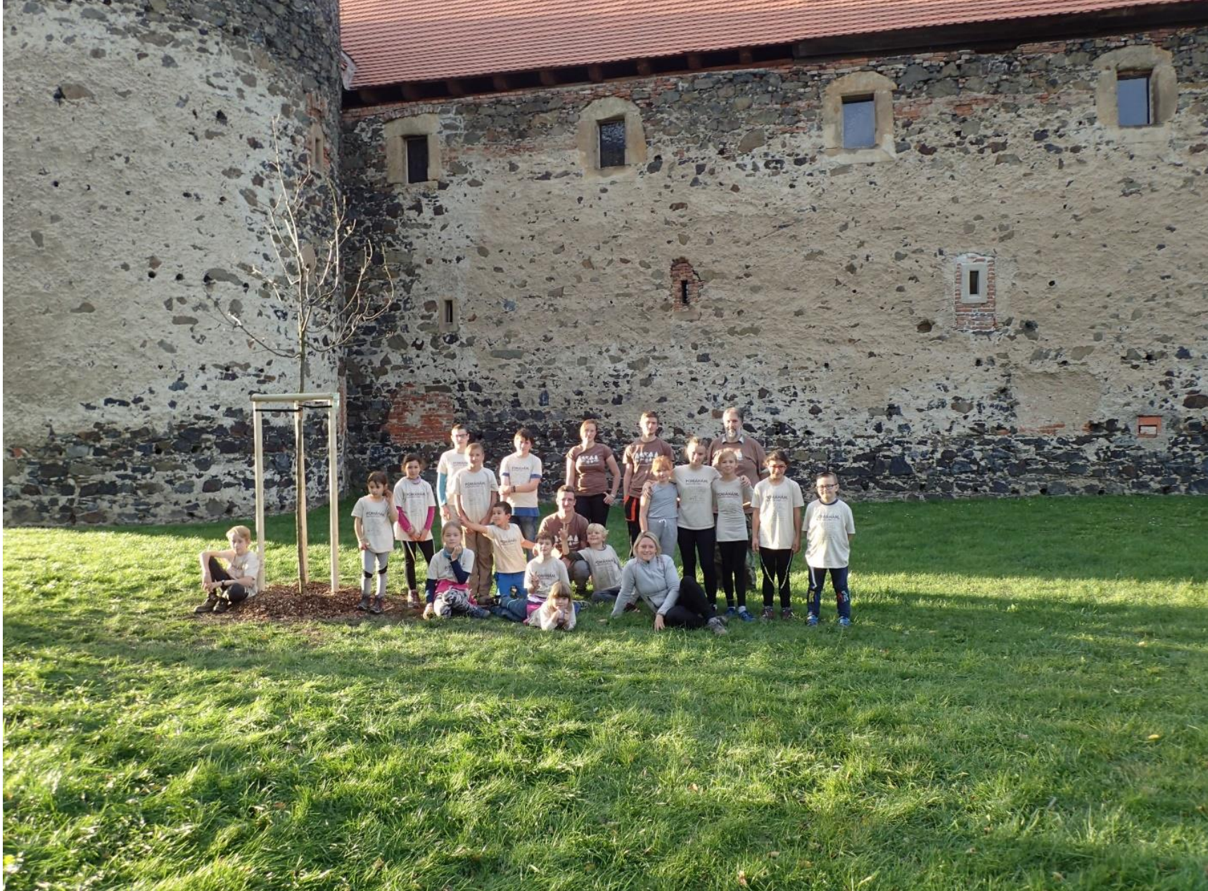
Akce 72 hodin na hradě Švihov, 2019